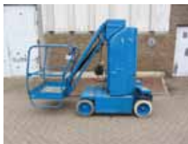
L12443 - Haulotte HM10P - 2000 Elektrisch - 10 Mtr. - 1248 Hrs. € 5.500