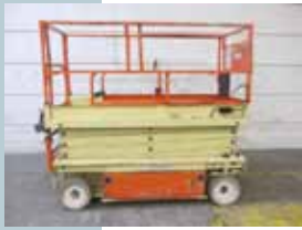
L12360 - JLG 2646E3 - 1999 Elektrisch - 9.92 Mtr. - / Hrs. € 2.750