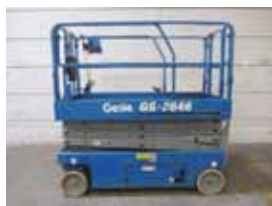
V12350 - Genie GS2646 - 2006 Elektrisch - 9.92 Mtr. - 219 Hrs. € 6.500