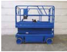
L12198 - Genie GS2646 - 2000 Elektrisch - 9.92 Mtr. - 747 Hrs. € 3.000