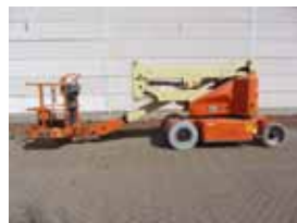
V12419 - JLG E400AN - 2005 Elektrisch - 14.19 Mtr. - 362 Hrs. € 14.000