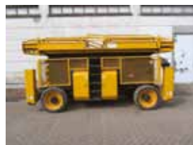
V12412 - Genie GS5390RT - 2001 Diesel 4x4 - 18.15 Mtr. - 3584 Hrs. € 11.500