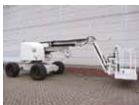
V11739 - Haulotte HA16SPX - 2005 Diesel 4x4 - 16 Mtr. - 2106 Hrs. € 14.500