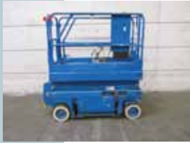
L12236 - Genie GS1530 - 2001 Elektrisch - 6.60 Mtr. - 505 Hrs. € 2.250