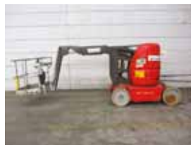
L11411 - Manitou 120AETJ - 2004 Elektrisch - 12.62 Mtr. - 2044 Hrs. € 11.250