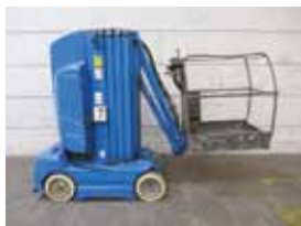
V12353 - Grove T1100C - 1999 Elektrisch - 11 Mtr. - 779 Hrs. € 6.250