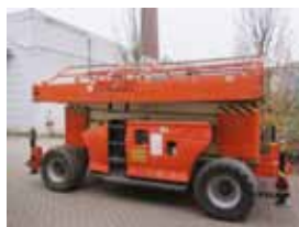
V11634 - JLG 4394RT - 2005 Diesel 4x4 - 15.11 Mtr. - 1626 Hrs. € 16.000