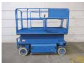
V12286 - JLG 2646E - 1998 Elektrisch - 9.92 Mtr. - 902 Hrs. € 2.750 - NEUE BATTERIEN.