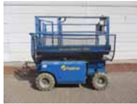
L12408 - Genie GS3268RT - 1999 Diesel 4x4 - 11.75 Mtr. - 2741 Hrs. € 4.500