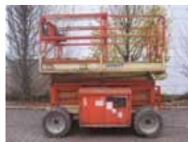
V11748 - JLG 260MRT - 2003 Diesel 4x4 - 9.92 Mtr. - 1653 Hrs. € 4.500