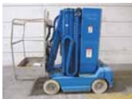
V12392 - Grove T860 - 1997 Elektrisch - 8.80 Mtr. - / Hrs. € 4.500