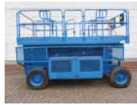
L11837 - Upright LX41E - 2000 Elektrisch - 14.30 Mtr. - / Hrs. € 3.000