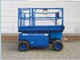
L12227 - Genie GS2668RT - 2000 Diesel 4x4 - 9.90 Mtr. - 2954 Hrs. € 4.250