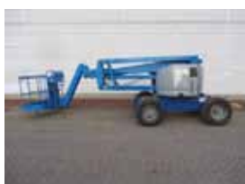
V12339 - Genie Z45/25JRT - 2001 Diesel 4x4 - 16 Mtr. - 3965 Hrs. € 11.500