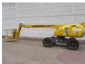
L11455 - Haulotte H16TPX - 2006 Diesel 4x4 - 15.44 Mtr. - 1624 Hrs. € 16.000