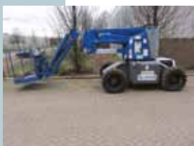
L11772 - Haulotte HA12PX - 2006 Diesel 4x4 - 12.62 Mtr. - 1866 Hrs. € 10.000