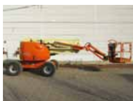
V12161 - JLG 450AJ - 2007 Diesel 4x4 - 15.72 Mtr. - 994 Hrs. € 25.000