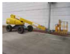
L11502 - Haulotte H21TX - 2007 Diesel 4x4 - 20.85 Mtr. - 1202 Hrs. € 24.500