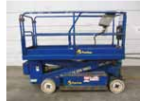
L11854 - Upright SL20 - 2001 Elektrisch - 8.10 Mtr. - 714Hrs. € 2.750