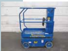
L11816 - Upright TM12 - 2000 Elektrisch - 5.70 Mtr. - / Hrs. € 2.750