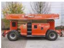
V11657 - Genie GS4390RT - 2004 Diesel 4x4 - 15.11 Mtr. - 1879 Hrs. € 15.000