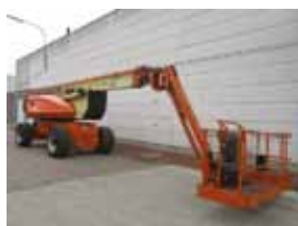
V12256 - JLG 1250AJP - 2005 Diesel 4x4 - 40.10 Mtr. - 2677 Hrs. € 85.000