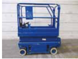
L12303 - Genie GS1930 - 1999 Elektrisch - 7.80 Mtr. - 621 Hrs. € 2.500