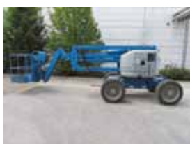
V11018 - Genie Z45/25JRT - 2006 Diesel 4x4 - 16 Mtr. - 1252 Hrs. € 22.500