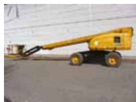
V12422 - JLG 660SJ - 1999 Diesel 4x2 - 22.12 Mtr. - 5880 Hrs. € 9.500

Lager: Industrielaan 30, 8790 Waregem, Belgium