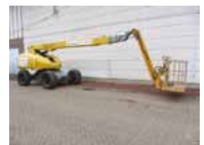
L11773 - Haulotte H23TPX - 2005 Diesel 4x4 - 22.60 Mtr. - 2859 Hrs. € 23.000