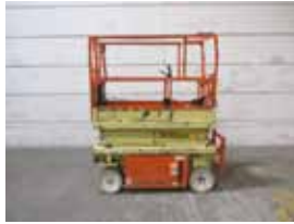
L12402 - JLG 1932E3 - 1999 Elektrisch - 7.79 Mtr. - 935 Hrs. € 2.500