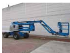
V11335 - Genie Z60/34RT - 2006 Diesel 4x4 - 20.39 Mtr. - 1339 Hrs. € 30.000