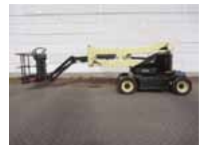
L12441 - JLG M45AJ - 2000 Bi-energy - 15.72 Mtr. - 1429 Hrs. € 9.250