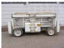
V11947 - Genie GS4390RT - 2001 Diesel 4x4 - 15.11 Mtr. - 2185 Hrs. € 9.750