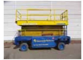
L12391 - Liftlux SL172/18E - 1998 Elektrisch - 19.20 Mtr. - / Hrs. € 8.000