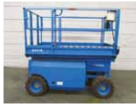
L12072 - Genie GS2668DC - 2001 Elektrisch - 9.90 Mtr. - 516 Hrs. € 4.500