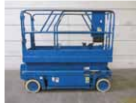
L12369 - Genie GS2032 - 2000 Elektrisch - 8.10 Mtr. - 444 Hrs. € 2.750