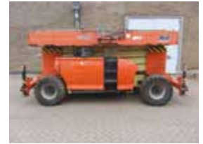
L12314 - JLG 4394RT - 2002 Diesel 4x4 - 15.11 Mtr. - 1257 Hrs. € 10.500