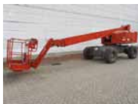
V12159 - Genie S65 - 1998 Diesel 4x2 - 21.90 Mtr. - 419 Hrs. € 9.000