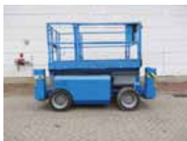
V11777 - Genie GS2668RT - 2005 Diesel 4x4 - 9.90 Mtr. - 1423 Hrs. € 8.000