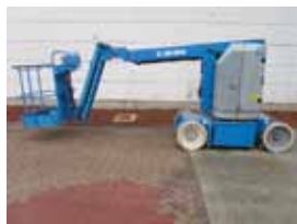
V11315 - Genie Z30/20N - 2007 Elektrisch - 11.10 Mtr. - / Hrs. € 16.250