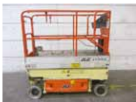
V12260 - JLG 1930ES - 2005 Elektrisch - 7.60 Mtr. - 246 Hrs. € 5.250 - NEUE REIFEN.