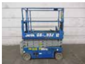
V12262 - Genie GS1932 - 2005 Elektrisch - 7.80 Mtr. - 269 Hrs. € 5.000