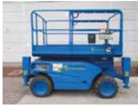
L11470 - Haulotte C10DX - 2006 Diesel 4x4 - 10.20 Mtr. - / Hrs. € 8.500