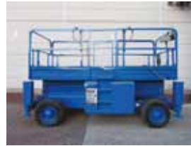
L11551 - Haulotte H12SX - 2007 Diesel 4x4 - 12 Mtr. - 1102 Hrs. € 12.500