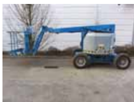
L11436 - Genie Z34/22RT - 2005 Diesel 4x4 - 12.62 Mtr. - 2316 Hrs. € 11.250