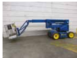
L12060 - Niftylift - 2000 Bi-energy - 15.60 Mtr. - / Hrs. € 8.500