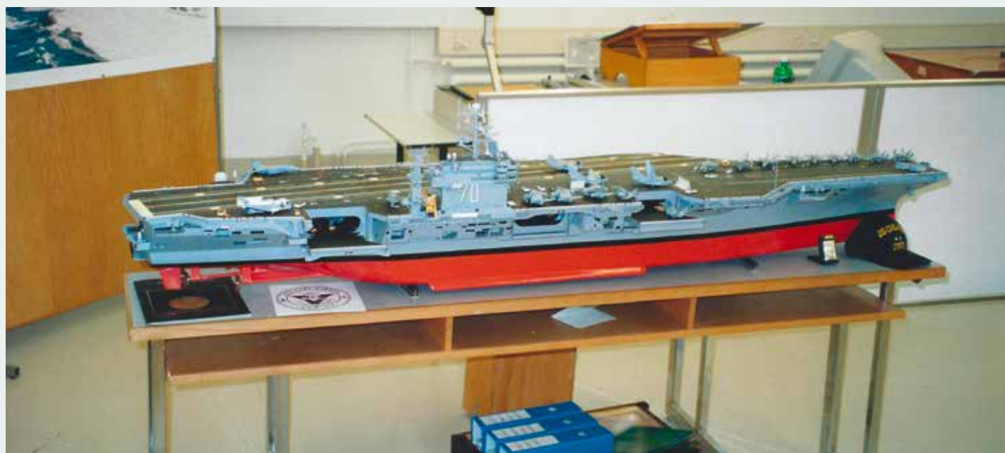
Der Flugzeugträger USS Carl Vinson CVN-70 im Maßstab 1:144.