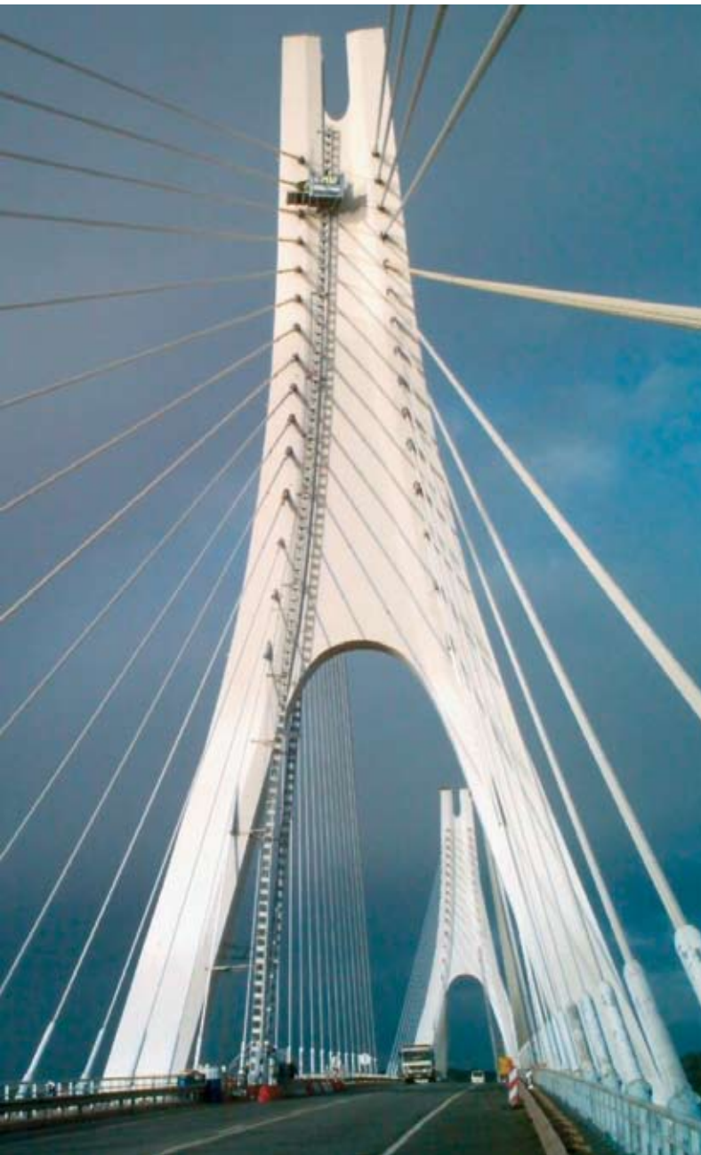
Insgesamt vier GEDA-Transportbühnen vom Typ 500 Z/ZP kommen bei den Sanierungsarbeiten an der Aradebrücke in Portugal zum Einsatz.

Sowohl für die 500 Z/ZP als auch für die 1500 Z/ZP des bayerischen Herstellers GEDA-Dechentreiter GmbH & Co. KG wird der 1,5 m lange Stahlmast in Modulbauweise einfach und bequem errichtet. Außerdem ist dieser Stahlmast ebenfalls passend für alle GEDA-Zahnstangenaufzüge und alle GEDA-Transportbühnen von 500 kg bis 2.000 kg Nutzlast. Das bedeutet niedrigere Investitionen und geringeres Lager-/Transportvolumen.