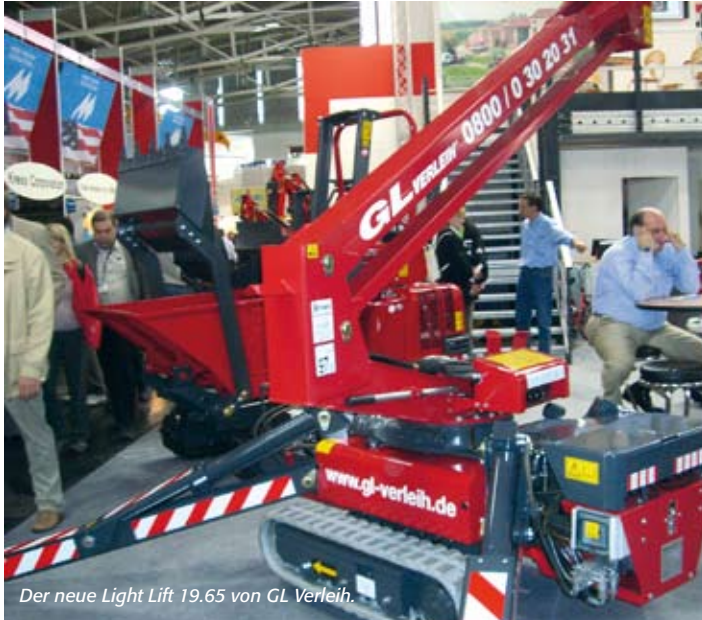
Der neue Light Lift 19.65 von GL Verleih.