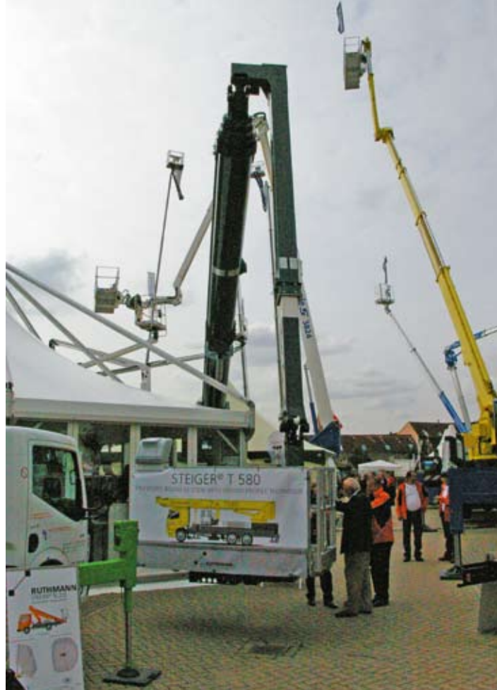
Ruthmann präsentierte auf der Apex den T 580 mit Unterarm-Rundprofilausleger.

Neben der Aufbaumöglichkeit auf Lkw-Fahrgestellen mit einem zulässigen Gesamtgewicht von 7,49 t – gepaart mit horizontal/vertikaler Abstützung – kann der T 275 auch mit senkrechten Stützen auf schwerem Chassis geordert werden.