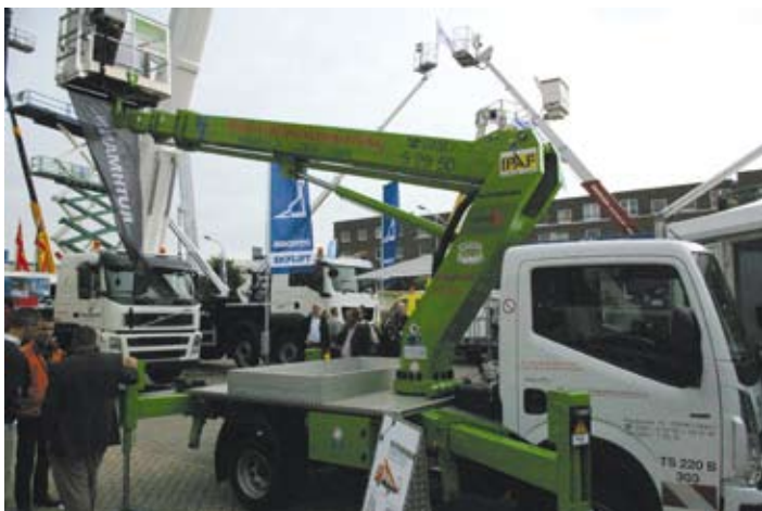
Ebenfalls in Apex ausgestellt war der TB 220 auf einem Renault Maxity.