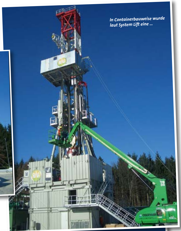
In Containerbauweise wurde laut System Lift eine ...

Am Bau war der System Lift-Partner Obermair-Transporte GmbH aus Oberndorf bei Schwanenstadt mit dem Einsatz einer Arbeitsbühne beteiligt. Die Bohranlage wurde in