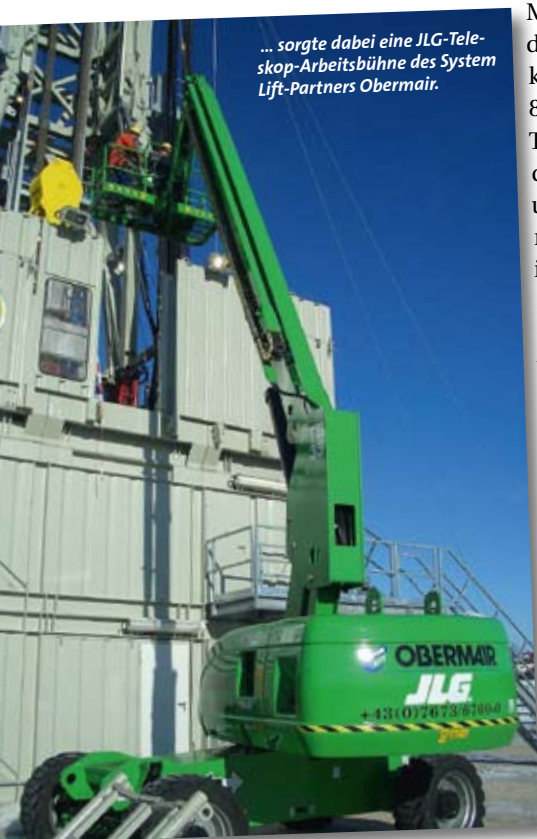
... sorgte dabei eine JLG-Teleskop-Arbeitsbühne des System Lift-Partners Obermair.