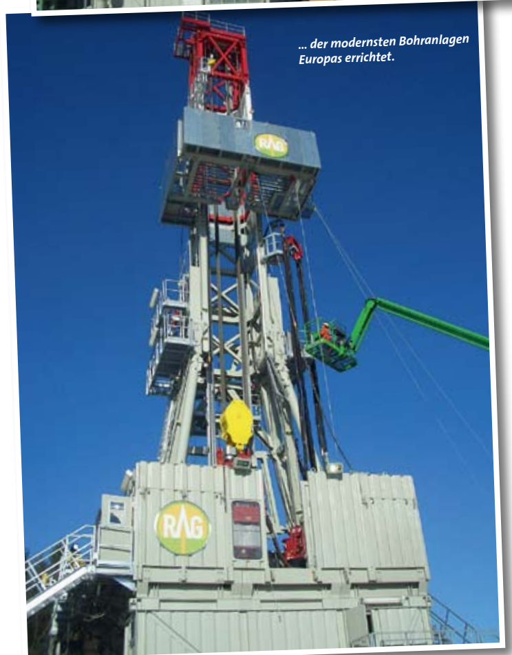
... der modernsten Bohranlagen Europas errichtet.