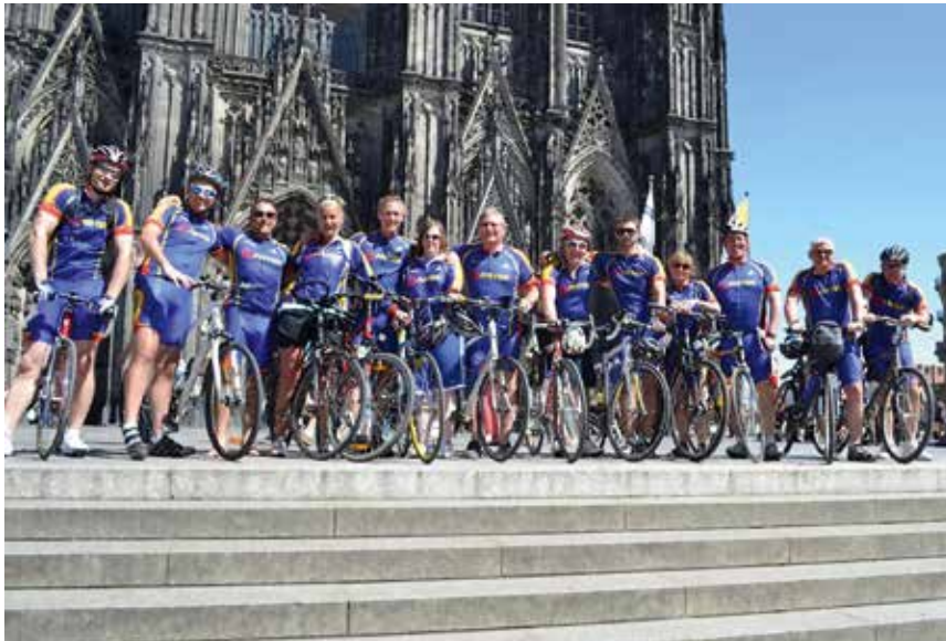
Am Ziel angekommen: die Radler am Kölner Dom.

Insgesamt nahmen 25 Teilnehmer an der Tour „Easy Rider“ teil, die am 18. Mai an der Europa-Zentrale in Acton (London) startete und in sieben Tagesetappen über Harwich, Hook of Holland, Rotterdam, Houten, Arnheim, Xanten, Düsseldorf bis nach Köln führte. Die meisten Teilnehmer legten ausgewählte Teilabschnitte