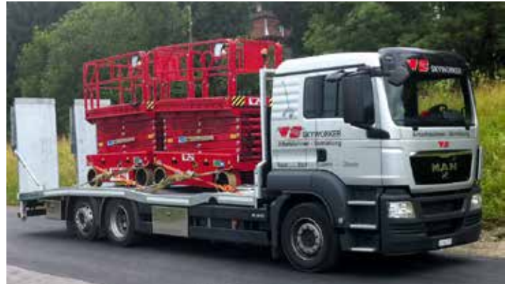
Das neue MAN Hebebühnentaxi der WS-Skyworker AG.

Die WS-Skyworker AG gehört eigenen Angaben zufolge in der gesamten Schweiz zu den führenden Vermietern von Hebebühnen, Staplern und Teleskopstaplern. Mit rund 450 Maschinen von 6 m bis 47 m hat die WS-Skyworker AG für jeden Einsatz das passende Gerät. Für die Verteilung der Hebebühnen durfte die Filiale in Luzern vor Kurzem ein neues Hebebühnentaxi in Betrieb nehmen. Der MAN 26.320 TGS mit tiefer Ladebrücke und 15 t Nutzlast eignet sich bestens für die Transporte. Über die entsprechend langen und seitlich verschiebbaren Laderampen findet jedes der über 80 verschiedenen Modelle den Weg auf die Ladebrücke.