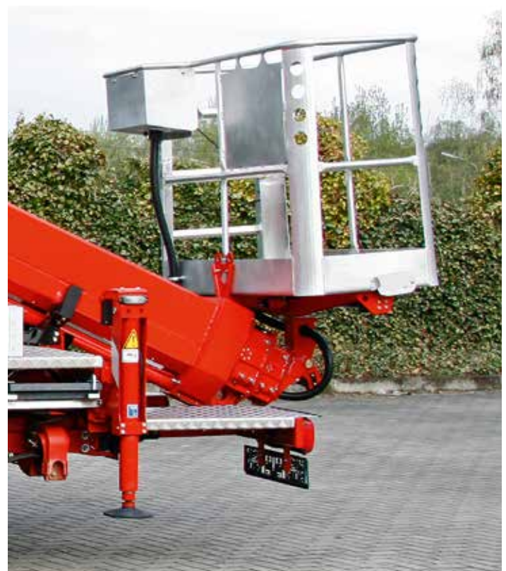
Im Rahmen einer TB-Steiger-Baureihen-Harmonisierung kommt beim neuen TB 220.2 ein neuer, gewichtsoptimierter Alu-Arbeitskorb zum Einsatz. Dieser verfügt auch über eine äußerst nützliche Reinigungsklappe. Auch Stützen und Grundrahmen sind jetzt baugleich zu anderen Modellen und damit auf aktuellstem Stand der Technik und Gewichtsoptimierung.

In diesem Zusammenhang berichtet Ruthmann auch über eine noch größere Trägerfahrzeugauswahl beim TB 270 und dem TBR 200. Beide Modelle sind ab sofort auch auf VW-Crafter aufbau- und lieferbar.