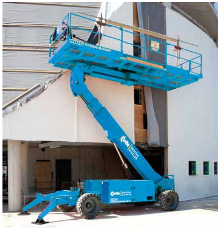
Ergänzt seit Kurzem den Fuhrpark von Collé: der MEC Titan Boom.

Um die Nachfrage der Kunden befriedigen zu können, werden von Collé Rental & Sales regelmäßig neue Maschinen eingekauft. Dabei wird sowohl in die Breite als in die Tiefe des Sortiments investiert.