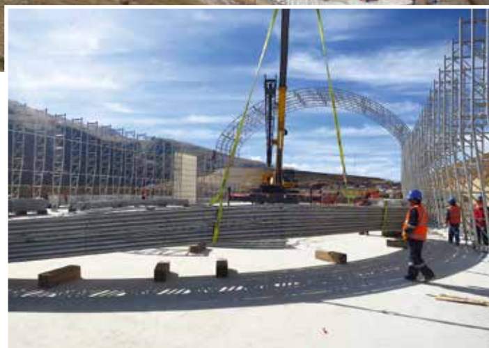
Neben Autokranen kamen ...