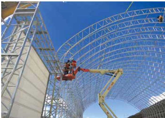
... auch Hubarbeitsbühnen ...