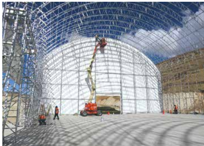
... zum Einsatz.