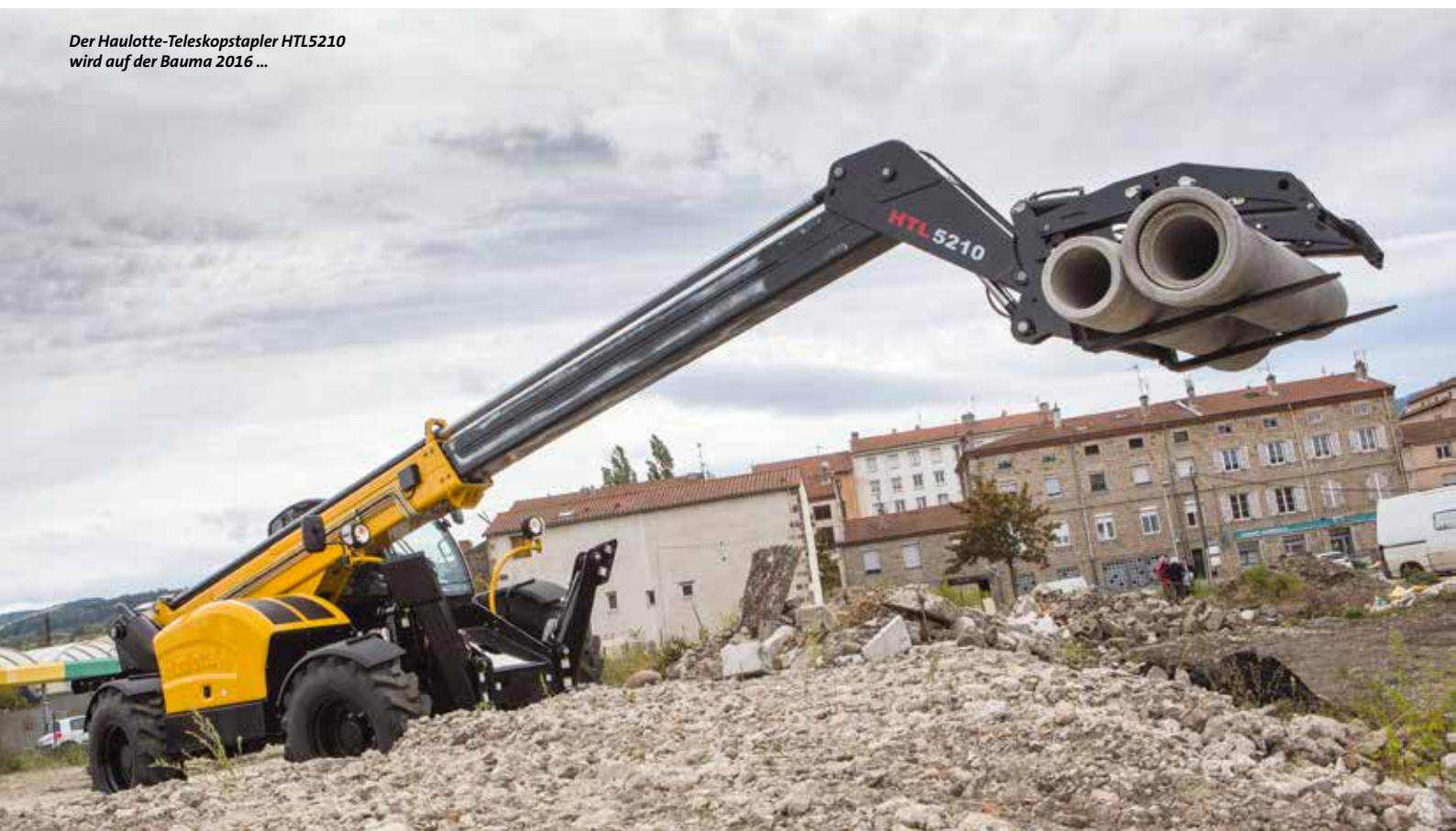
Der Haulotte-Teleskopstapler HTL5210 wird auf der Bauma 2016 ...

Ergänzt wird die neue Reihe der „Heavy Load Capacity“-Reihe durch die Modelle HTL6508 und HTL7210. Dabei handelt es sich laut Haulotte um sehr kraftvolle Schwerlast-Telesko-