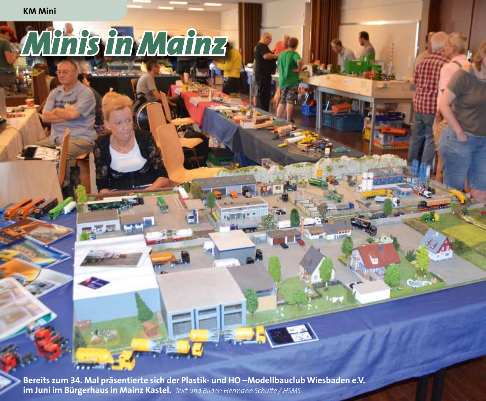
Bereits zum 34. Mal präsentierte sich der Plastik- und HO –Modellbauclub Wiesbaden e.V. im Juni im Bürgerhaus in Mainz Kastel. Text und Bilder: Hermann Schulte / HSMS

Aus angrenzenden Bundesländern, aber auch aus Frankreich und Tschechien fanden sich die Aussteller im Eingangsfoyer und im Veranstaltungssaal ein, um ihre Schmuckstücke zu präsentieren.