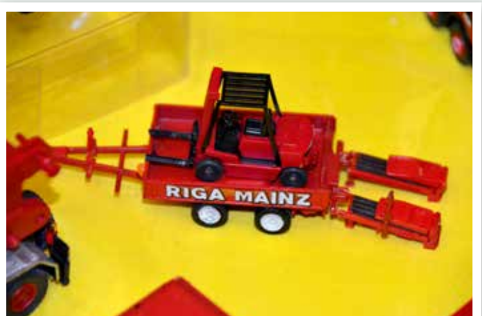
Und der Stapler darf auch mit.