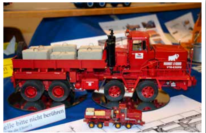
Alle Größen vertreten.