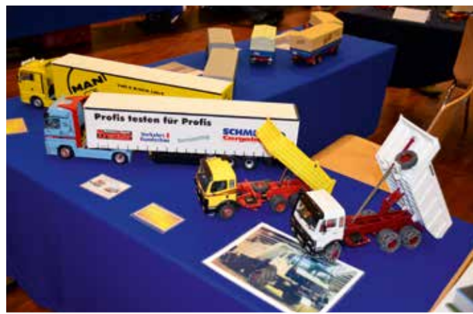
Das Original ist mit Schneeketten ausgerüstet – die dürfen beim Modell dann natürlich auch nicht fehlen.