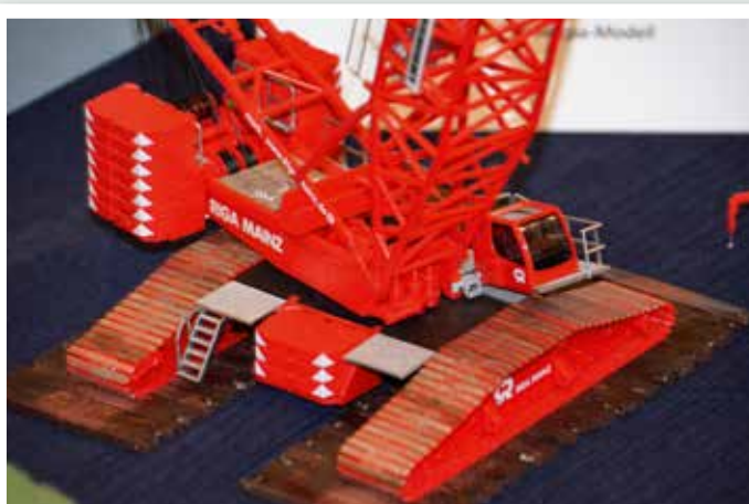
Liebherr-Raupe von Riga Mainz als gesupertes Modell.