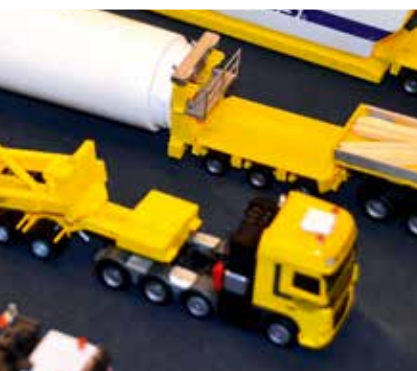
Die Ausstellung war in diesem Jahr wieder gut besucht und bot Modelle für jeden Geschmack.

Bitte die Modelle nicht berühren. NO PLS TOUCHED S.T. PL PLEASE DON'T TOUCH!