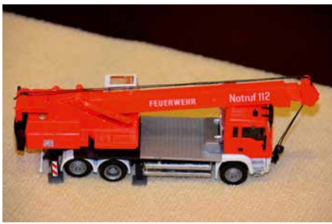
Immer wieder ein schönes Motiv: Fahrzeuge und Krane der Feuerwehr.