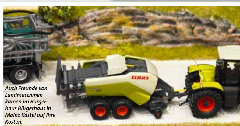
Auch Freunde von Landmaschinen kamen im Bürgerhaus Bürgerhaus in Mainz Kastel auf ihre Kosten.

portbranche. Ins Auge fiel hier ein Stand de Modellbauers, der sich auf Modelle einer österreichischen Firma spezialisiert hat. Bis ins kleinste Detail, vor allem auch historische Modelle, wurden nachgebaut und zusätzlich mit entsprechenden Originalfotos dokumentiert. Ins Auge fiel auch eine FAUN HZ 70.80/50 W 8x8 Gigant in zwei