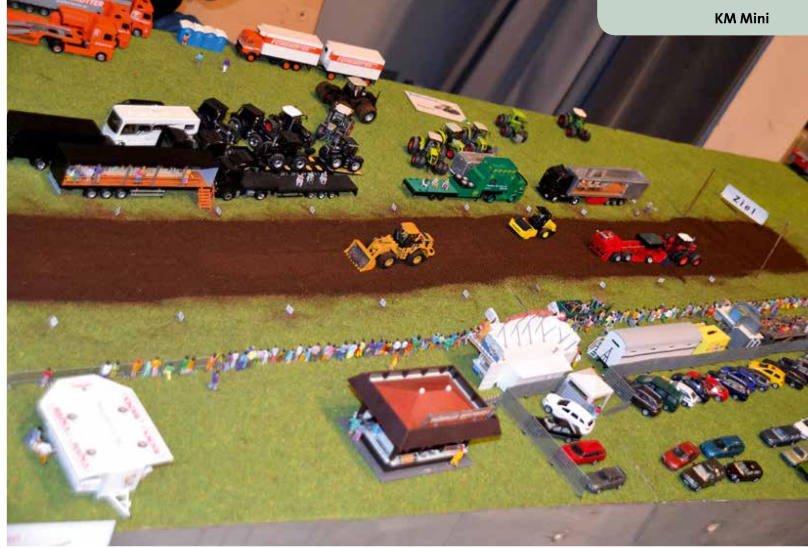
Modelle auf der Rennstrecke.