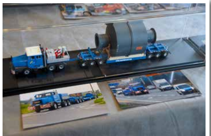
Schwerlast in Felbermayr-Farben.