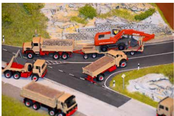
Auch zum Thema „Bau“ waren viele Modelle zu sehen, darunter auch diverse historische.