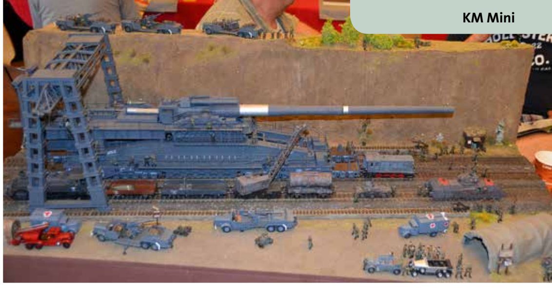
Thema Militär – auch hier gerne historisch.