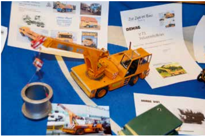
Der Demag V 73 – ein Blick in die Krankabine zeigt: auch hier ist alles historisch.