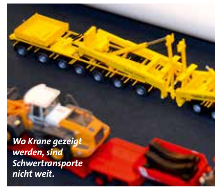
Wo Krane gezeigt werden, sind Schwertransporte nicht weit.