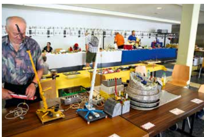
Ein Funktionsdiorama gab es an diesem Tisch zu sehen.