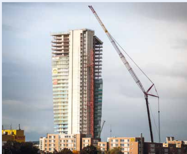
In Vollausstattung mit Wippe und seitlichem Superlift kam der 500-Tonner zum Einsatz.

Für den Abbau des 125 m hohen Kolosses war der AC 500 – Scholpp-Bezeichnung: S-GK 500 – mit 160 t Ballast, 84 m Wippe, seitlichem Superlift und einer Ausladung von 56 m aus der flotten Flotte gefragt, aber auch Konzentration, Präzision, Stärke und Maßarbeit des Teams vor Ort. Die Durchführung solch eines Einsatzes ist nur in einem funktionierenden Team möglich. Hand