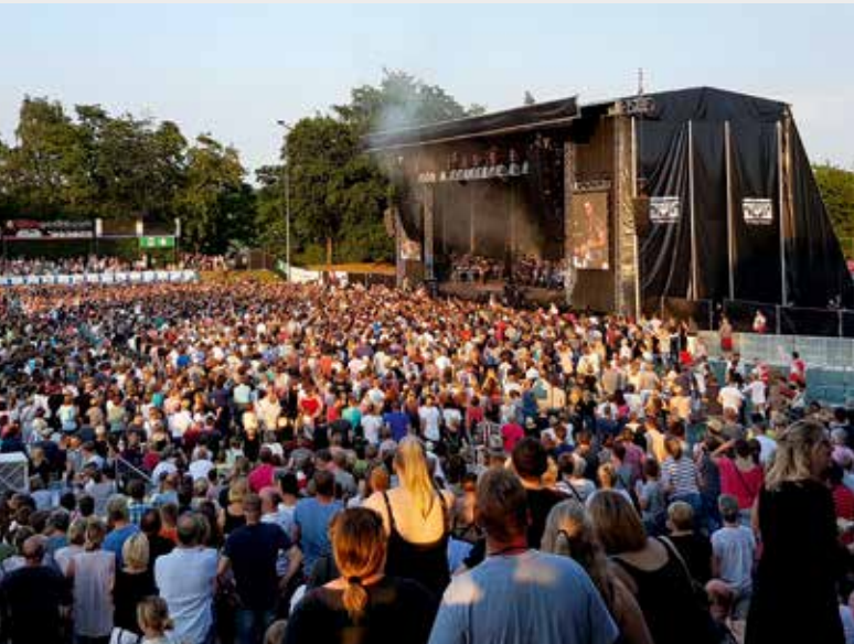
Damit beim Bocholter Open Air die Gäste im Stadion „Am Hünting“ richtig feiern konnten...

Christoph Schares schickte hier zum Auf- und Abbau einen Liebherr LTM 1100-4.2 in das Stadion – eigentlich etwas größer als von Megaforce gefordert. Aber der Bocholter Stadtmarketing-Chef Ludger Dieckhues, Organisator des Open Air Konzertes, warnte schon vor dem Bühnenbau: „Der Rasen des Stadions darf nicht beschädigt werden, Staplerverkehr ist