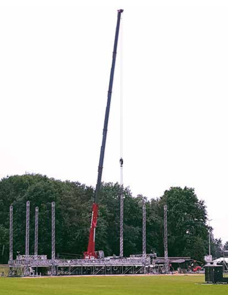
... war der LTM 1100-4.2 von Schares im Einsatz. Hier beim Aufbau der Megaforce Towerbühne TVG II am 27.5.2018.

schwierig, die Entfernungen vom Backstage Bereich bis zum entferntesten Tower betragen auch schon leicht 45 m in der Diagonalen – besser ausreichend Reichweite und Tragkraft vorhalten.“