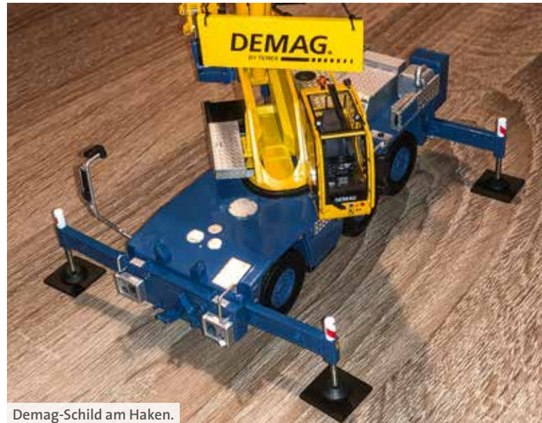
Demag-Schild am Haken.