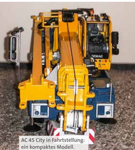
AC 45 City in Fahrtstellung: ein kompaktes Modell.