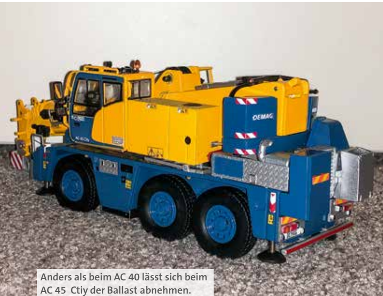
Anders als beim AC 40 lässt sich beim AC 45 City der Ballast abnehmen.