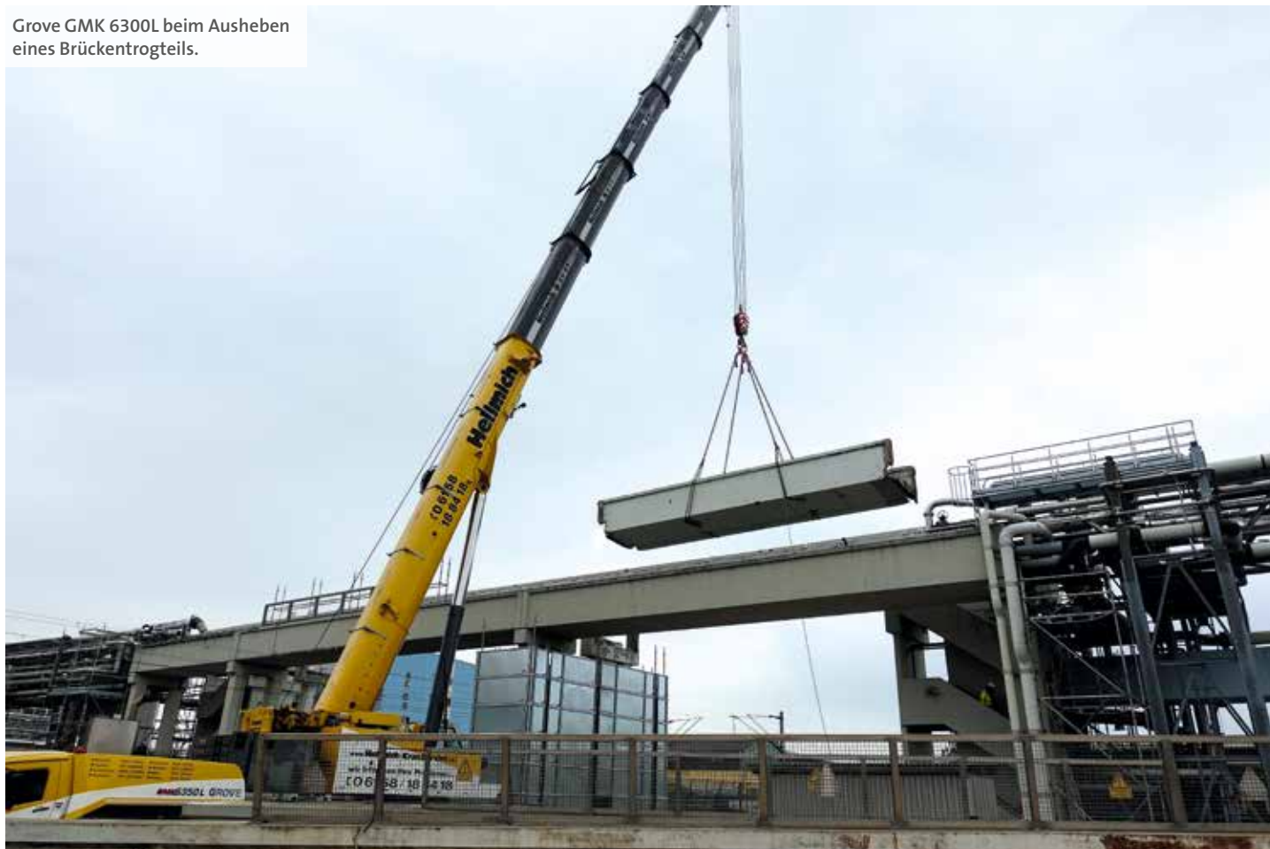
Grove GMK 6300L beim Ausheben eines Brückentrogteils.