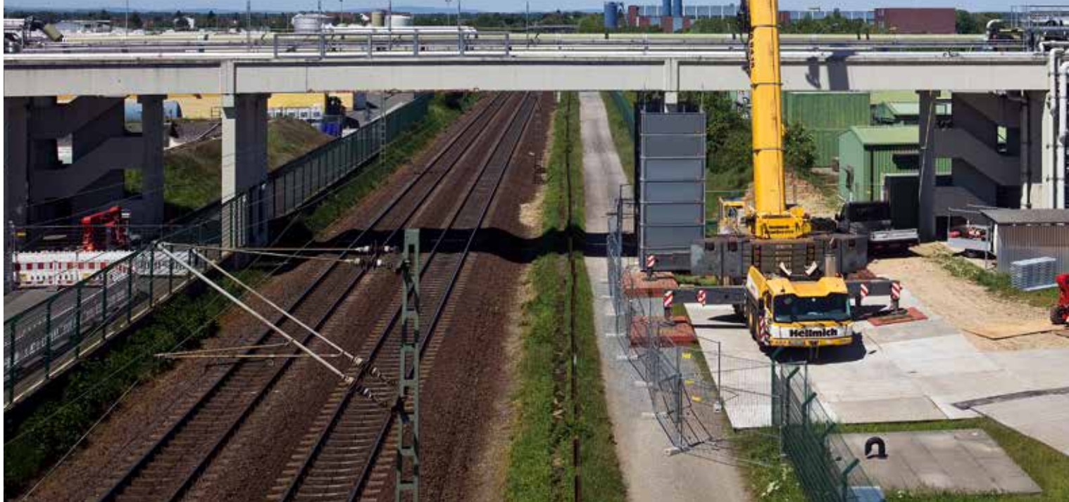
Text und Bilder: Anke Steffens

Die De-Montage einer Brücke über die ICE-Strecke Mannheim – Frankfurt bei Gernsheim auf dem Merck-Gelände sorgte für Spannung bis zum letzten Moment. Gerade einmal 20 Minuten nach Abschluss der Arbeiten fuhr schon wieder der erste ICE auf der Strecke.