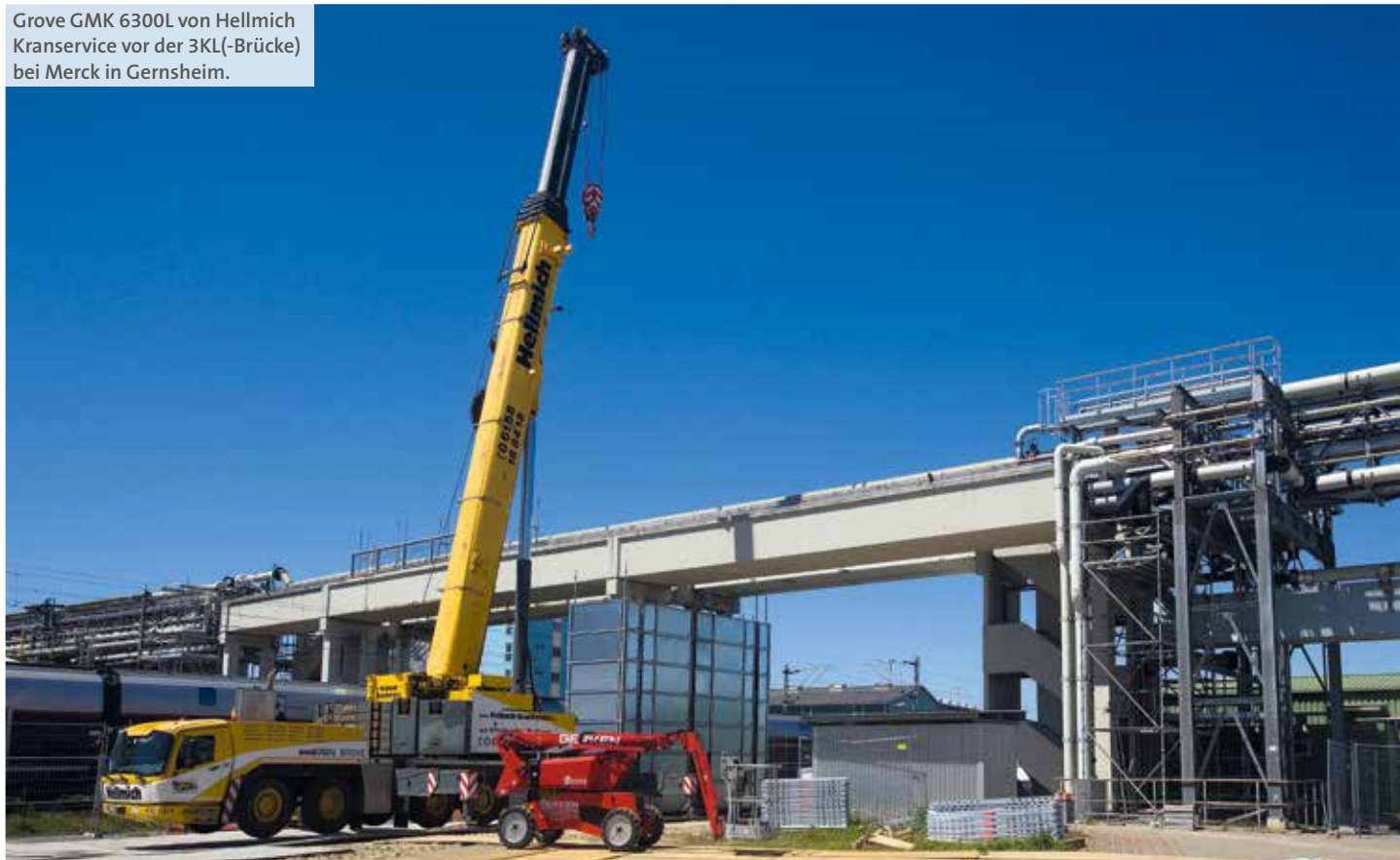
Grove GMK 6300L von Hellmich Kranservice vor der 3KL(-Brücke) bei Merck in Gernsheim.

Langsam, aber sicher löst sie sich vom Boden und schwebt nach oben über die Bahntrasse.