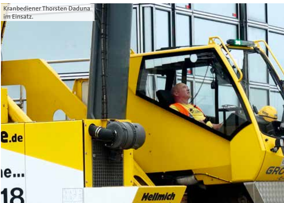
Kranbediener Thorsten Daduna im Einsatz.

in zwei L-förmige Stücke geteilt. Der Funkenregen, der dabei entsteht, ist beeindruckend.