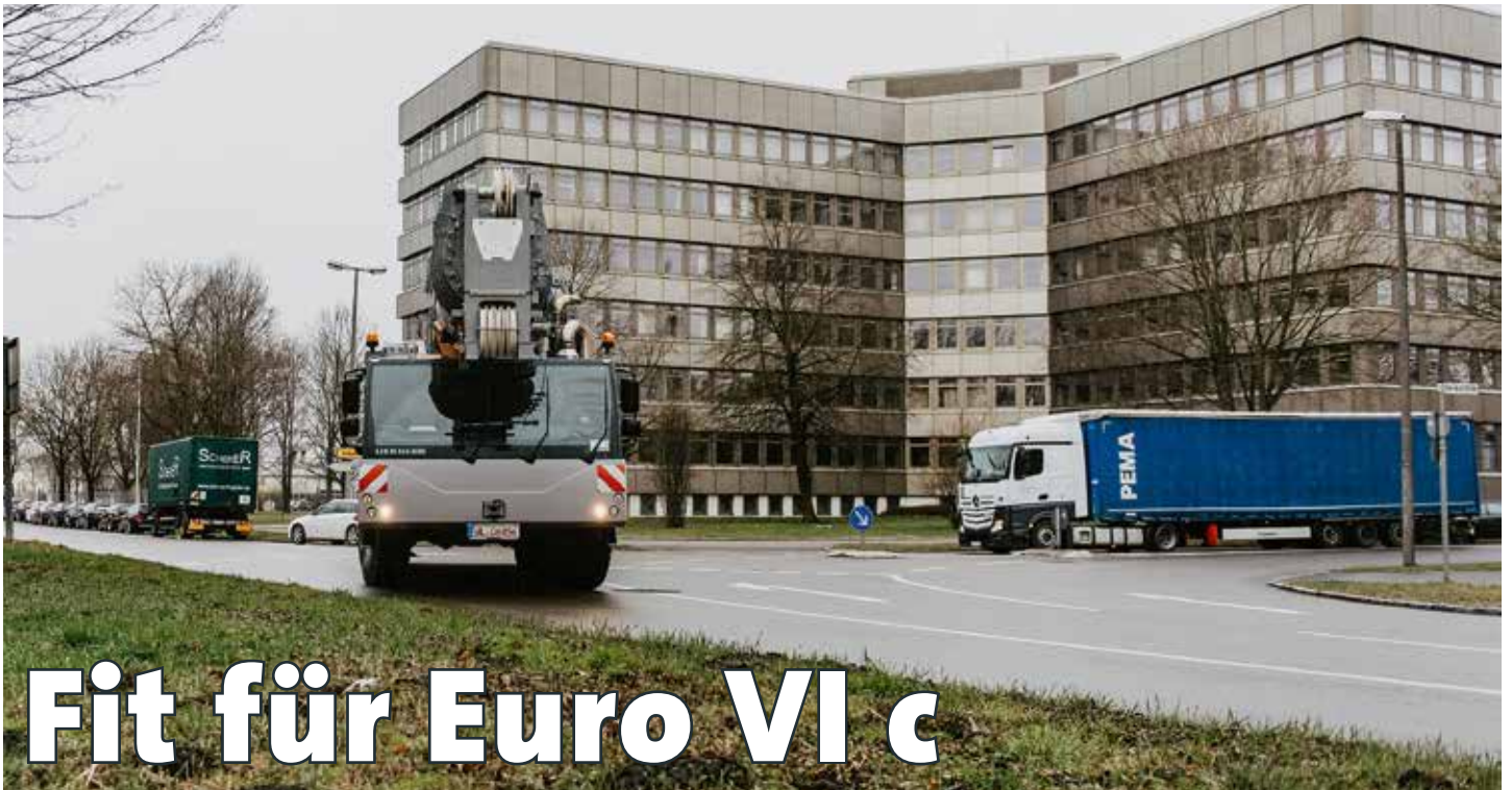
Der LTM 1160-5.2 bei den Messfahrten, zusammen mit dem Vergleichs-Lkw.

Dass sogar Großfahrzeuge wie der 5-achsige LTM 1160-5.2 mit einem Fahrgewicht von 60 t die hohen Onroad-Standards der Euro-Norm VI c erfüllen können, bewies der schwäbische Kranhersteller jüngst in einer Testreihe mit dem TÜV NORD und dem Engineering-Partner IAV.