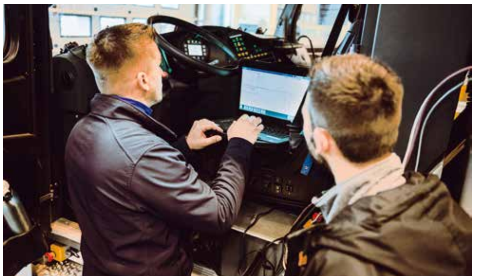
Die Experten des TÜV NORD und der IAV installieren die Prüfgeräte.

... verglich man die Emissionen des geladenen 40 t-Lkw Mercedes Actros 1842 mit dem 60 t schweren Liebherr-Kran LTM 1160-5.2.