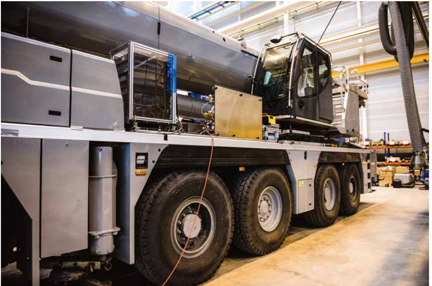
Die PEMS-Messanlage am LTM 1160-5.2.

eingesetzt und fahren pro Fahrzeug und Jahr nur etwa 10.000 Kilometer“, so Geschäftsführer Dr. Hamme. „Die Messungen zeigen, dass wir uns hinter modernen Fernverkehr-Lkw nicht verstecken müssen, das freut uns sehr. Außerdem zeigt es uns: Es ist gut und richtig, dass wir trotz der geringen Fahrstrecken pro Jahr modernste Motor- und Getriebetechnologie einsetzen. Kombiniert mit einer aufwendigen, effizienten Abgasnachbehandlung haben wir jetzt bei unseren Mobilkränen diesen geprüften Stand erreicht, mit der wir in puncto Sauberkeit und Umweltschutz wegweisende Maßstäbe setzen.“