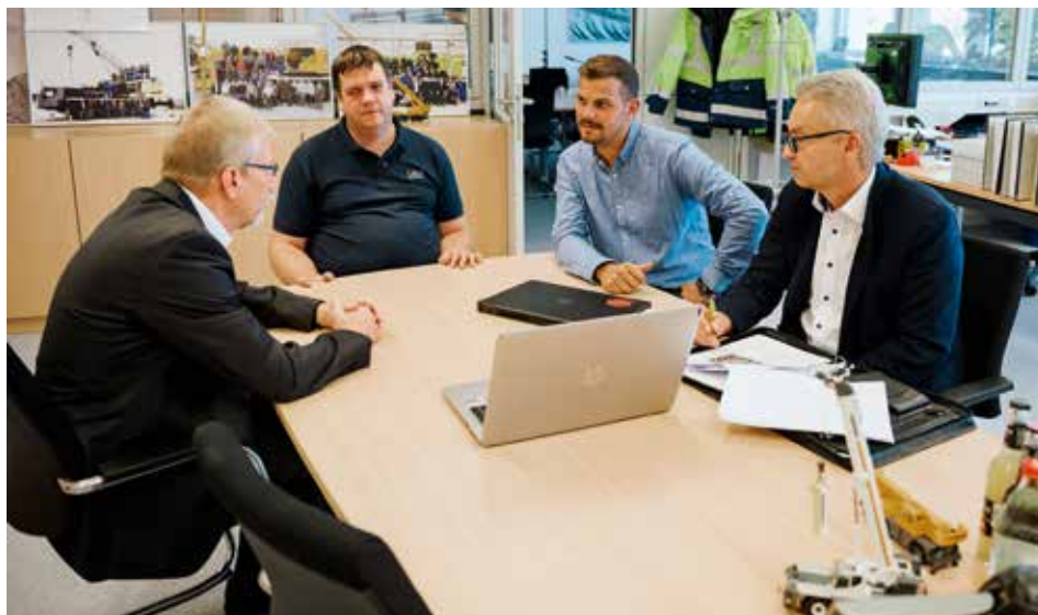
Erfolgreiche Tests: Die Ergebnisse werden durch die IAV präsentiert.

„Mobilkrane werden weltweit im Vergleich zum Lkw ja nur in sehr begrenzten Stückzahlen