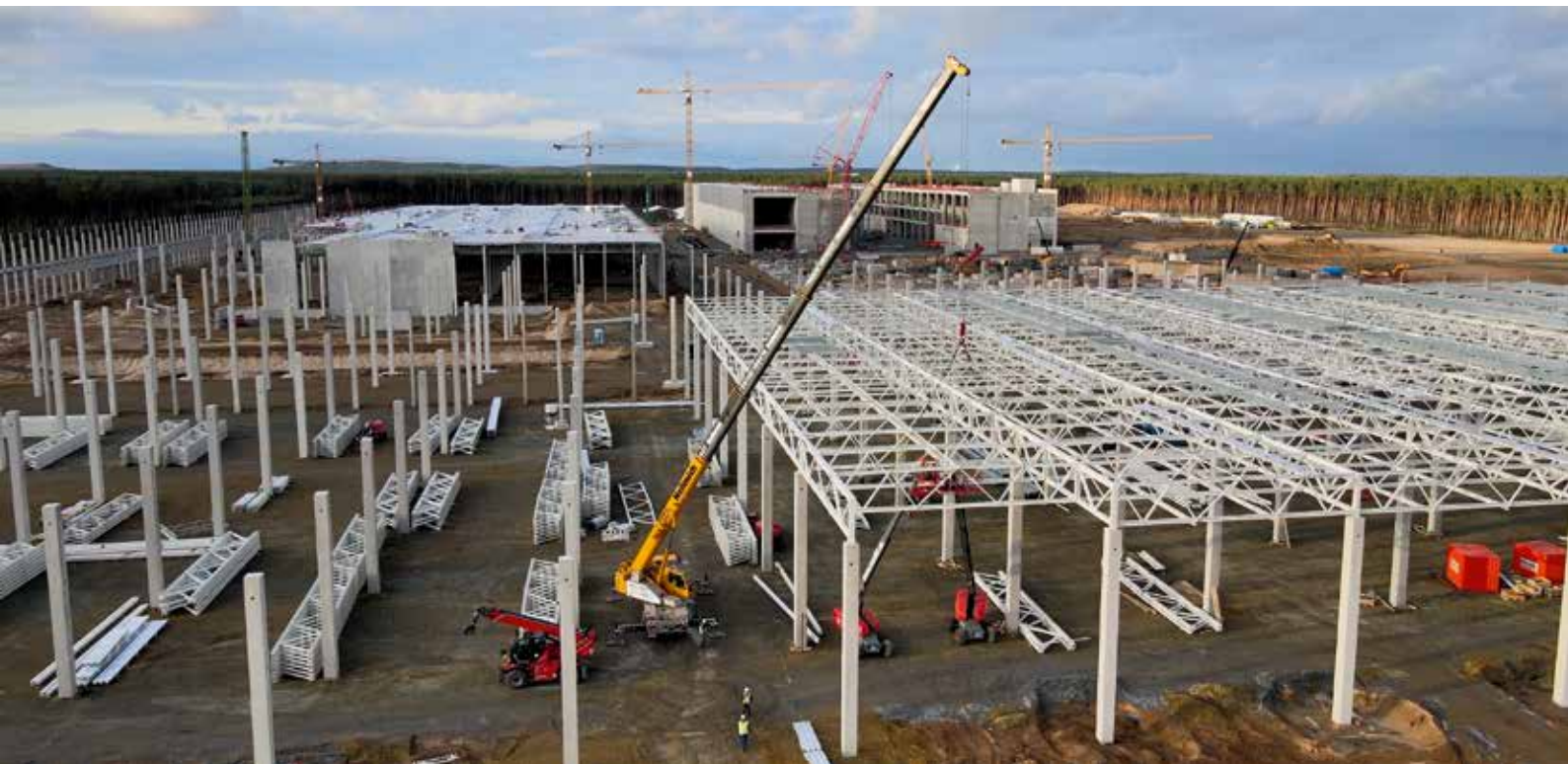
Just-in-time-Montage: mit mehreren Kranen werden gleichzeitig Stützen, Binder und Dachverbindungen montiert.

Um diesem Anspruch gerecht zu werden, setzt Hellmich auf zuverlässige Krantechnik: Insgesamt ist das Unternehmen gleich mit vier Tadano All-Terrain-Kranen in Grünheide aktiv. Jeweils zwei Tadano ATF 70G-4 in der 44-Meter-Variante und zwei ATF 110G-5 mit 110 t Tragkraft arbeiten an der Fertigstellung der Gigafactory mit. Ihre Aufgaben: Betonstützen und Brandwände stellen sowie Stahlbinder – also Träger für die Dachkonstruktion – und Dachblechpakete heben.