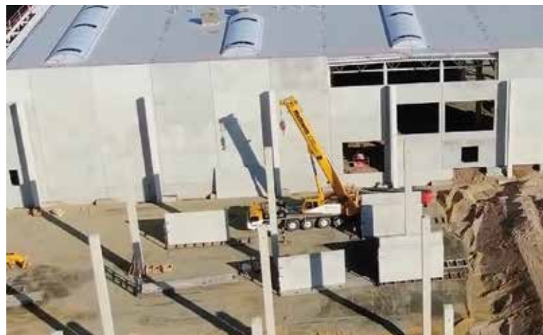
Das fast fertige Projekt.