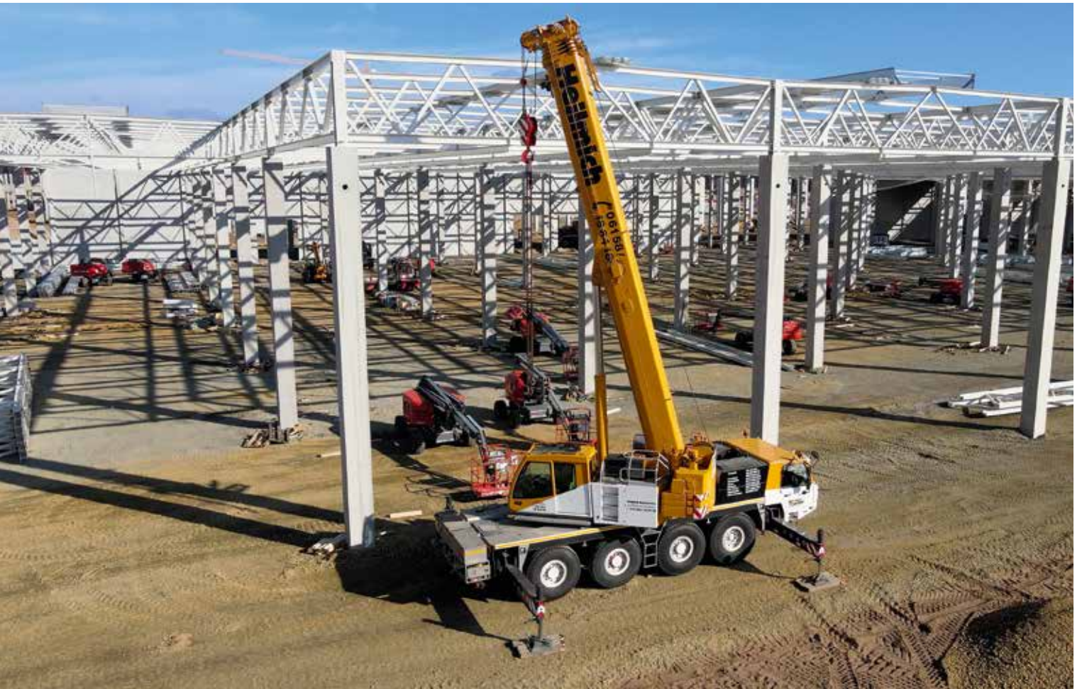
Die Dachkonstruktion für die Montagehalle...