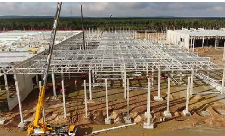
Montage der Dachbinder.