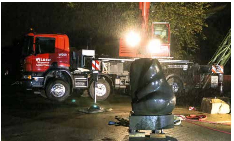
Macke am Ohr: Das Kunstwerk wurde glücklicherweise nur leicht beschädigt.

Seit 2019 befinden sich verschiedene denkwürdige, unbewegliche Gestalten in den Wupper: Störsteine, von verschiedenen Künstlern gestaltet, zieren die renaturierte Wupper und erinnern, zumindest in Teilen, an die Stadtgeschichte. Sie haben aber vor allem einen praktischen Zweck: Sie fördern die Eigendynamik