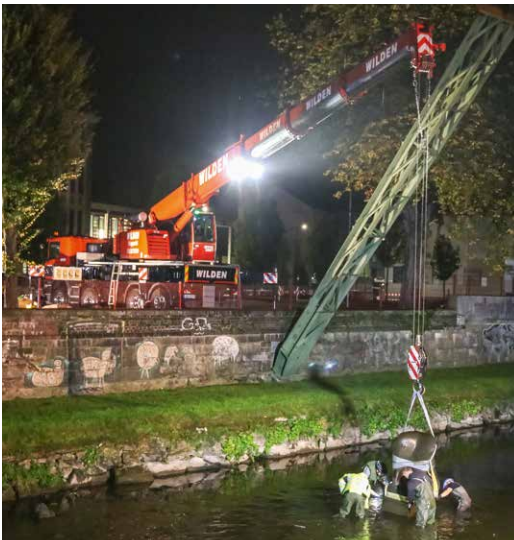
Am Haken: Der LTF 1045-4.1 hebt den sanften Riesen zurück in die Wupper.

Dabei half der Kranverleih Wilden, der dem zuständigen Verein Neue Ufer unmittelbar nach der Flut spontan seine Hilfe angeboten hatte. Los ging die Aktion um kurz nach Mitternacht und war planmäßig vor 5 Uhr beendet, um den Schwebebahnverkehr nicht zu stören. Mit einem Liebherr-Teleskop-Aufbaukran LTF 1045-4.1 hoben Teilnehmer der Rettungsaktion die Skulptur an und setzten sie an ihren ursprünglichen Platz im Fluss. Der Zeitpunkt war aus Sicherheitsgründen gewählt worden, weil direkt über der Wupper die