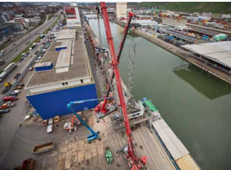
Der Scholpp-Einsatz aus der Vogelperspektive.