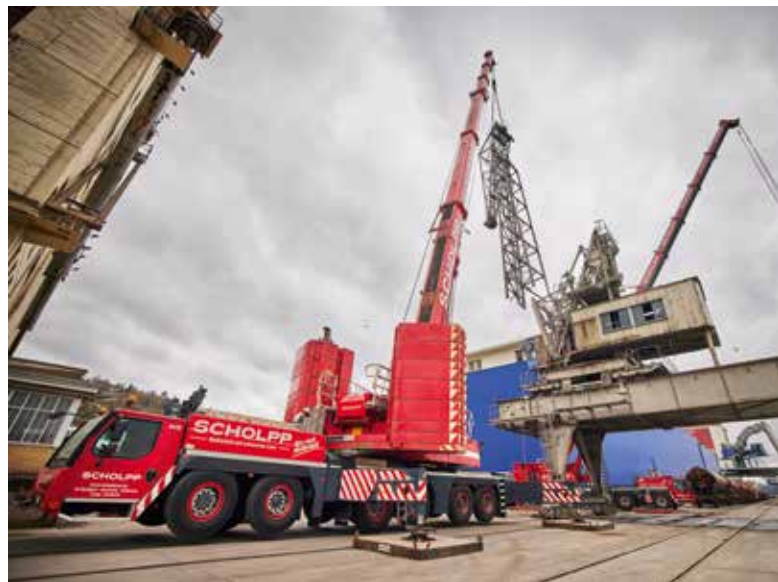
Aushub des Hafenkran-Auslegers.