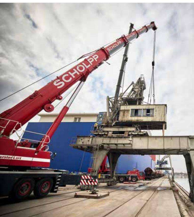
Demontage des Hafenkran-Oberwagens.