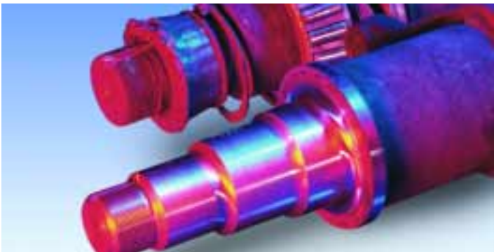
Erneuern eines beschädigten Achsstummels und der Lagersitze am Beispiel einer Anhängerachse.