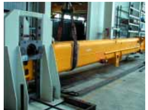
Am Auslegerprüfstand können die Ausleger ohne Kran getestet werden.