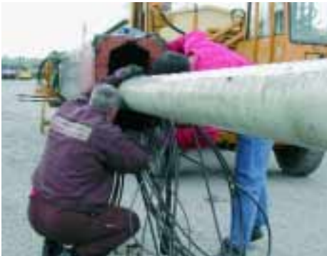
Reparatur von Ausschiesbesysteme