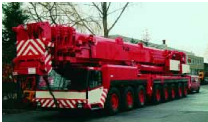
Manch einen Kran hat es übel erwischt, wie bei diesem Brandschaden. Doch auch solch hoffnungslos erscheinenden „Patienten“ kann geholfen werden.