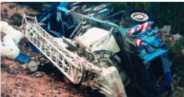
Da lief nichts mehr. Bei diesem 160-Tonner war eine komplette Instandsetzung erforderlich.