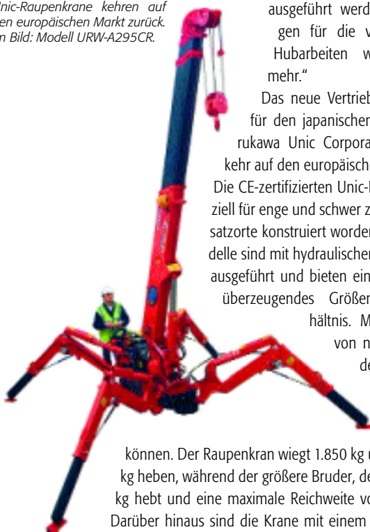
Unic-Raupenkrane kehren auf den europäischen Markt zurück. Im Bild: Modell URW-A295CR.

Das neue Vertriebsnetz markiert für den japanischen Hersteller Furukawa Unic Corporation die Rückkehr auf den europäischen Markt. Die CE-zertifizierten Unic-Krane sind speziell für enge und schwer zugängliche Einsatzorte konstruiert worden. Alle drei Modelle sind mit hydraulischen Abstützungen ausgeführt und bieten ein laut Hersteller überzeugendes Größen-/Leistungsverhältnis. Mit einer Breite von nur 600 mm ist der 295C schmal genug, um Normtüren passieren zu können. Der Raupenkrane wiegt 1.850 kg und kann 2.900 kg heben, während der größere Bruder, der 506CL, 3.000 kg hebt und eine maximale Reichweite von 16 m bietet. Darüber hinaus sind die Krane mit einem umfangreichen Sicherheitspaket ausgestattet.