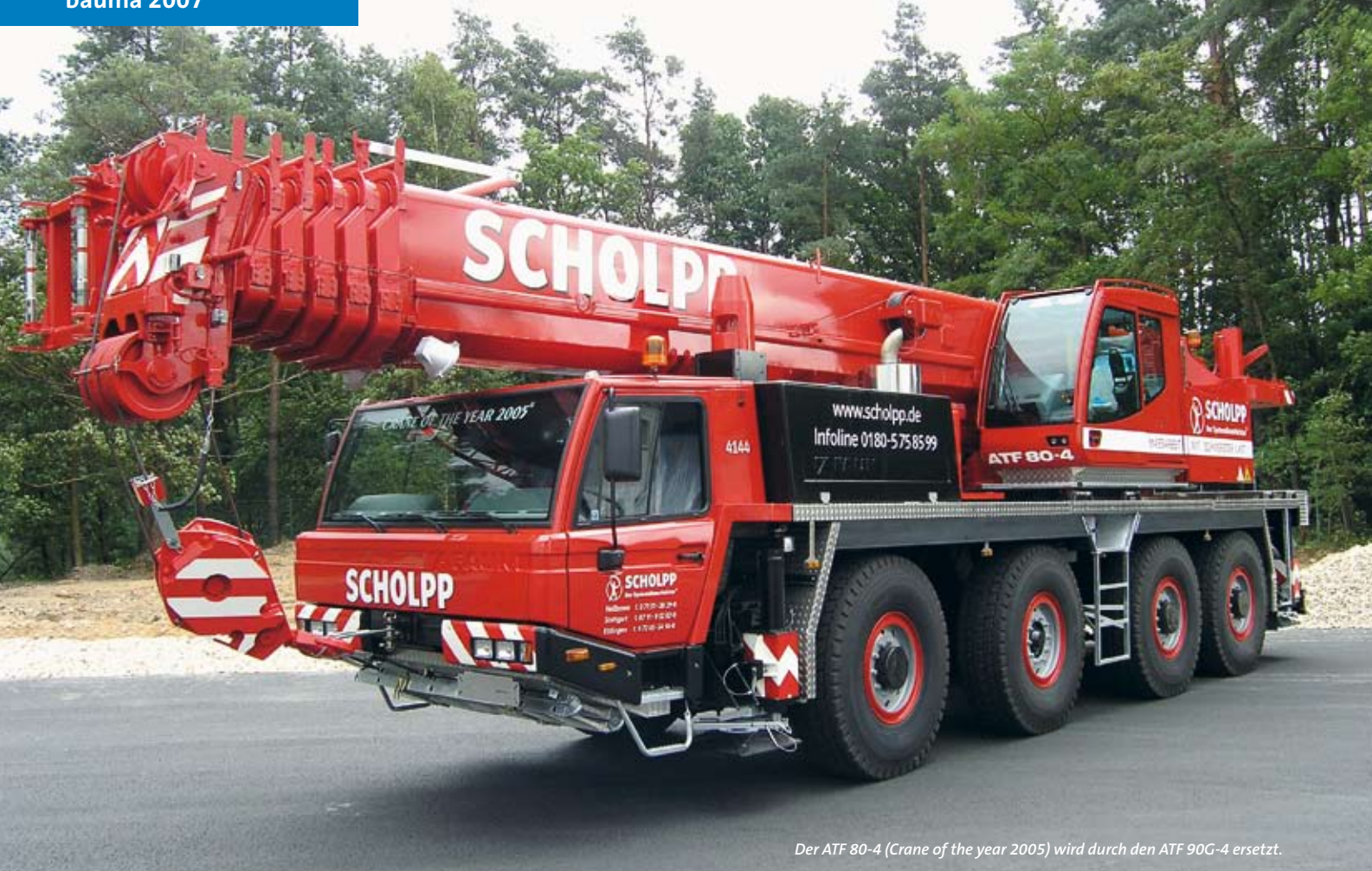
Der ATF 80-4 (Crane of the year 2005) wird durch den ATF 90G-4 ersetzt.

Noch ist der 5-achsige ATF 220G-5 das Flaggschiff der Tadano Faun-Flotte. Auf der Bauma wird der ATF 360G-6 vorgestellt, der dann das „Regiment“ übernimmt. Beim 220-Tonner wurden unter anderem die Tragfähigkeiten im Ausladungsbereich von 12 bis 22 m erhöht. Damit empfiehlt sich der ATF 220G-5 insbesondere für die Montage von Turmdrehkränen. Mehr Informationen hierzu gibt es im Info-Kasten auf der S. 52 dieser Ausgabe.