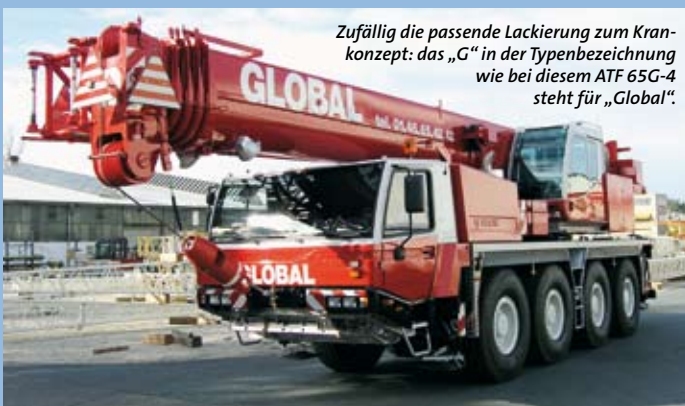
Zufällig die passende Lackierung zum Krankonzept: das „G“ in der Typenbezeichnung wie bei diesem ATF 65G-4 steht für „Global“.

Erstmalig hatte das Unternehmen zur Bauma 2004 mit dem ATF 110G-5 und dem ATF 160G-5 das neuartige Krankonzept der G-Typen vorgestellt. Das „G“ steht dabei für „Global“ und unterstreicht den Anspruch des Unternehmens, seine Kunden mit Kranen zu beliefern, die überall auf der Welt eingesetzt werden können. Egal, welche gesetzlichen Bestimmungen gelten, egal welche Einsatzbedingungen vorherrschen – mit den G-Kranen von Tadano Faun soll den Kranbetreibern immer die passende Maschine zur Verfügung stehen.