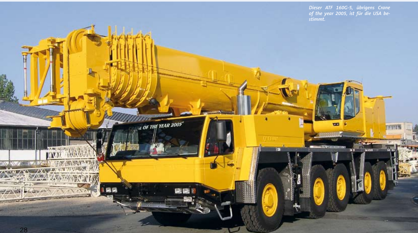
Dieser ATF 160G-5, übrigens Crane of the year 2005, ist für die USA bestimmt.

Eine stattliche Auslegerverlängerung – und zwar im wahrsten Sinne des Wortes – hat Tadano Faun beim neuen ATF 50G-3 realisiert, der den ATF 45-3 ersetzt. Im Gegensatz zu seinem Vorgänger bringt er es nicht nur auf 50 t statt 45 t maximale Tragkraft, sondern er bietet auch einen 40 m langen Hauptausleger. Das sind 6 m mehr als beim Vorgängermodell. Dabei garantiert das Teleskopiersystem mit zwei Zylindern und Seilen ein schnelles Aufrüsten. Wem 40 m Haupt-