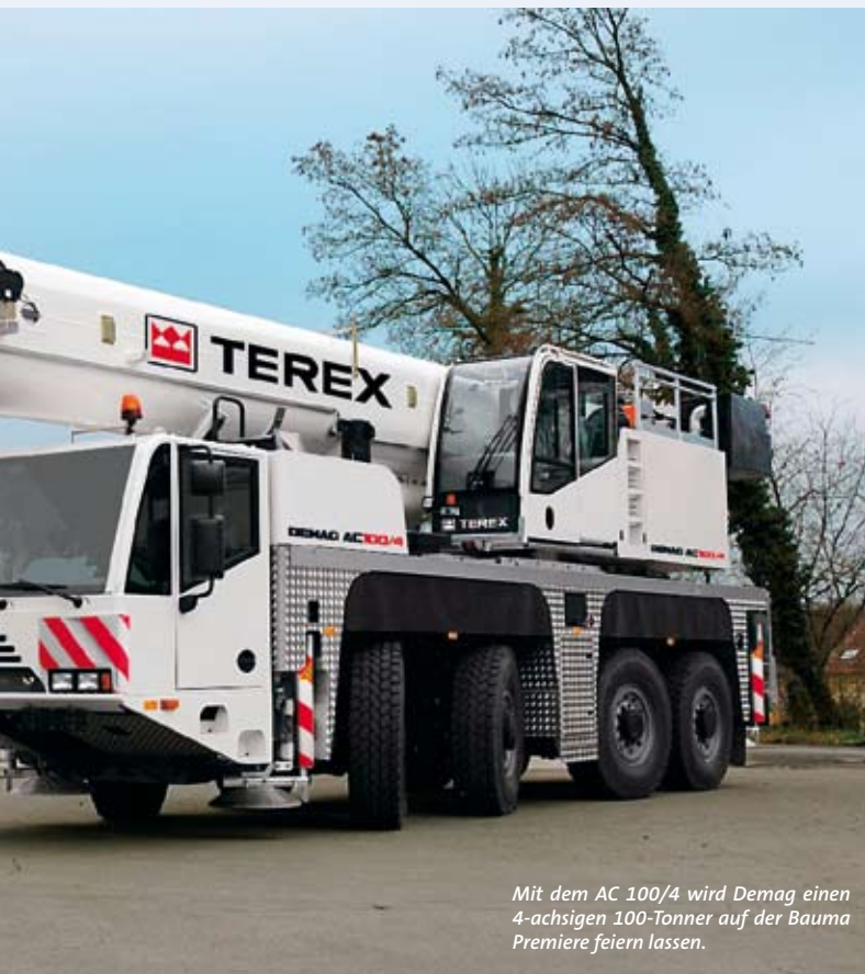
Mit dem AC 100/4 wird Demag einen 4-achsigen 100-Tonner auf der Bauma Premiere feiern lassen.