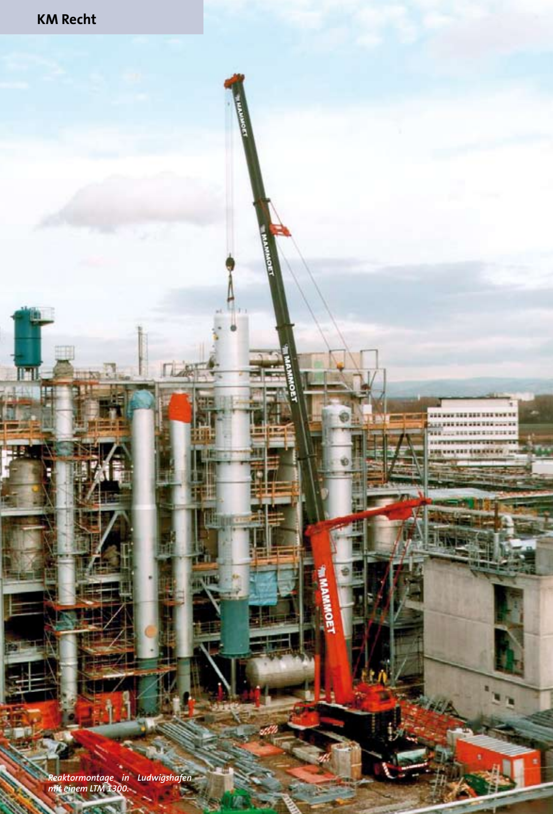
Reaktormontage in Ludwigshafen mit einem LTM 1300.

firmen gegründet. Montagen über die schlichte Grobmontage hinaus sollen damit ebenso angeboten werden können, wie Montagen ohne vorangegangenen oder nachfolgenden Transport, egal, ob nun horizontal mittels Schwerlast-Equipment oder vertikal mittels Mobilkran.