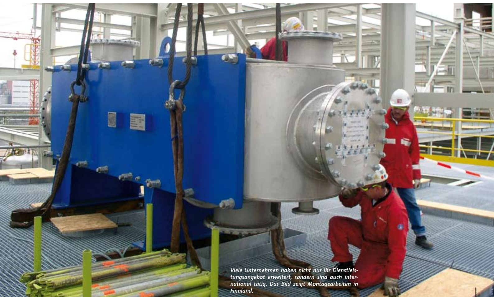
Viele Unternehmen haben nicht nur ihr Dienstleistungsangebot erweitert, sondern sind auch international tätig. Das Bild zeigt Montagearbeiten in Finnland.

Diskussion stehenden Vertragsentwurf Ihrem Versicherungsmakler, der Ihnen nach Abstimmung mit Ihrem Schwerguthaftungs-Versicherer eine rechtsverbindliche Auskunft erteilen wird, ob und inwieweit Ihre nach der Individualvereinbarung vorgesehene Haftung durch Ihre Schwerguthaftungs-Versicherung gedeckt ist oder nicht.