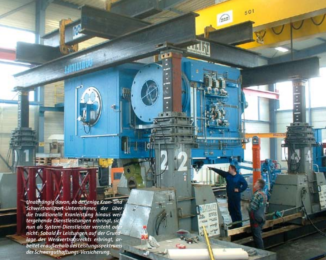
Unabhängig davon, ob derjenige Kran- und Schwertransport-Unternehmer, der über die traditionelle Kranleistung hinaus weitgehendende Dienstleistungen erbringt, sich nun als System-Dienstleister versteht oder nicht: Sobald er Leistungen auf der Grundlage des Werkvertragsrechts erbringt, arbeitet er außerhalb des Leistungsspektrums der Schwerguthaftungs-Versicherung.

ziehungsweise Bautätigkeiten. Mobilkrane, Stapler oder Hubgerüste dienen lediglich als Hilfsmittel, um das Gewerk zu montieren beziehungsweise zu errichten, vergleichbar mit einem Turmdrehkran auf einer ganz normalen Hochbaustelle.