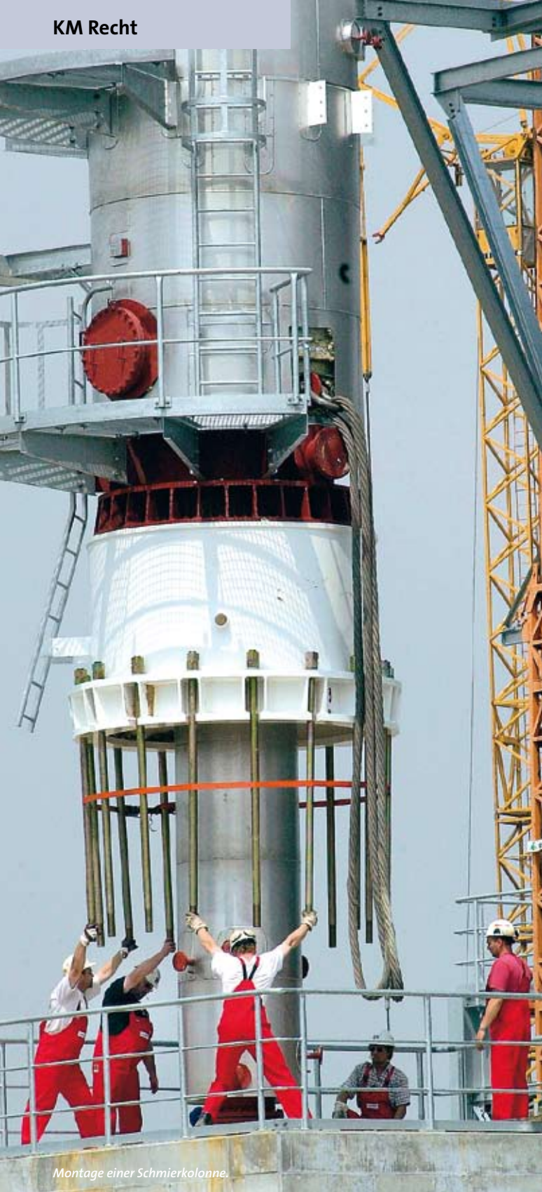
Montage einer Schmierkolonne.

sicherung im Verlauf unserer Ausführungen erschöpfend erläutert haben, kommen wir nicht umhin, hinsichtlich der Betriebshaftpflicht-Versicherung auf so unerfreuliche Stichworte wie „Erfüllungsanspruch“ und „Tätigkeitsschaden“ hinzuweisen.