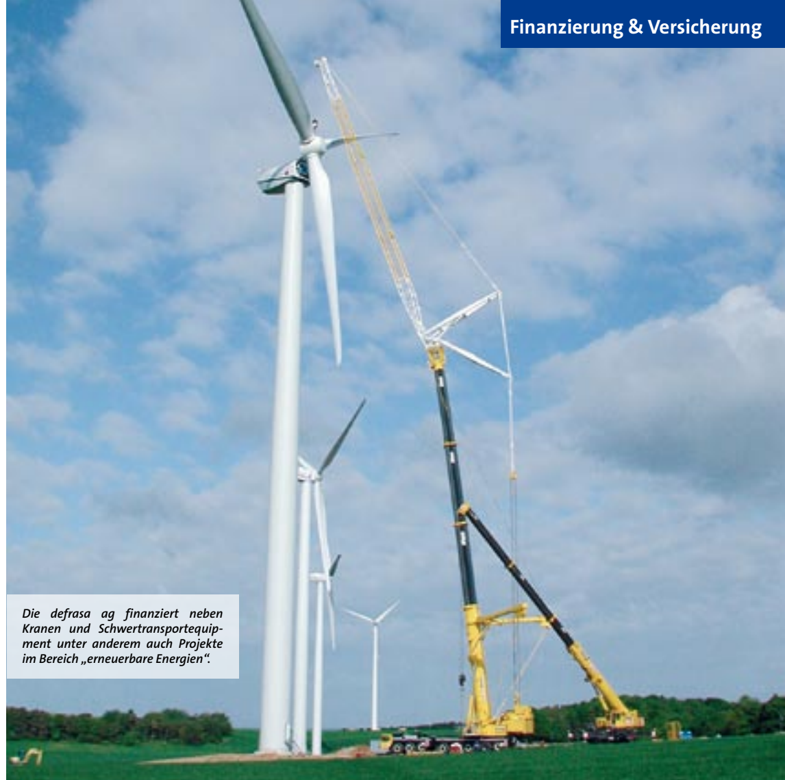
Die defrasa ag finanziert neben Kranen und Schwertransportequipment unter anderem auch Projekte im Bereich „erneuerbare Energien“.

Der Finanzierungsbedarf der meisten Vermieter in der Kran- und Schwerlastbranche wird zukünftig relativ hoch sein, wobei sich die Hausbanken bei der Finanzierung dieser Objekte auf Grund der Eigenkapitalschwäche auch weiterhin eher zurückhalten. Durch Leasing ist es möglich, die Ratingziffern deutlich zu verbessern. Trotz der Unternehmenssteuerreform und der hieraus resultierenden Gewerbesteuerpflicht für Leasingraten besteht weiterhin ein klarer Trend zum Leasing, um die Bilanzrelation im Hinblick auf die Anforderungen von Basel II positiv zu beeinflussen. Die defrasa ag sowie auch die MWS Leasing bieten deshalb maßgeschneiderte Finanzierungen für ihre Kunden an, wobei selbstverständlich auch Versicherungen mit angeboten werden. Die notwendige Flexibilität kann durch saisonabhängige Raten oder durch einen mietfreien Vorlauf gewährleistet werden, um den besonderen Liquiditäts-