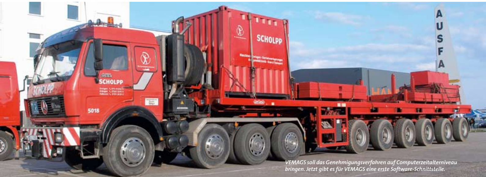
VEMAGS soll das Genehmigungsverfahren auf Computerzeitalterniveau bringen. Jetzt gibt es für VEMAGS eine erste Software-Schnittstelle.

Im August 2007 ging mit VEMAGS das neue online-basierte Genehmigungsverfahren für Großraum- und Schwertransporte an den Start. Im März dieses Jahres wurde die Geschichte von VEMAGS weitergeschrieben: auf der CeBIT 2008 wurde die erste Software-Schnittstelle zu dem System vorgestellt.