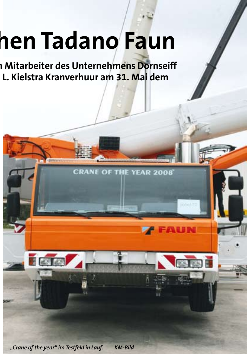
„Crane of the year“ im Testfeld in Lauf.

Der „Crane of the year 2008“ und mittlerweile in großen Stückzahlen in alle Welt ausgelieferte ATF 220G-5 erregte bei der Vorführung inklusive des