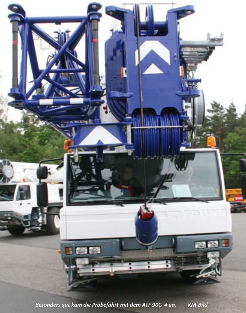
Besonders gut kam die Probefahrt mit dem ATF 90G-4 an.