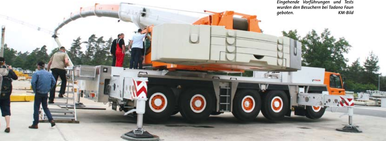
Eingehende Vorführungen und Tests wurden den Besuchern bei Tadano Faun geboten.