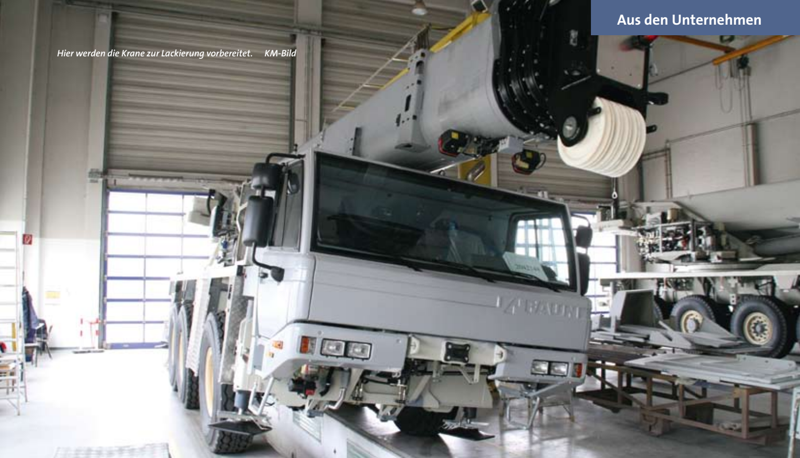
Hier werden die Krane zur Lackierung vorbereitet.

lerweile in Lauf hergestellten „Großkrane“.