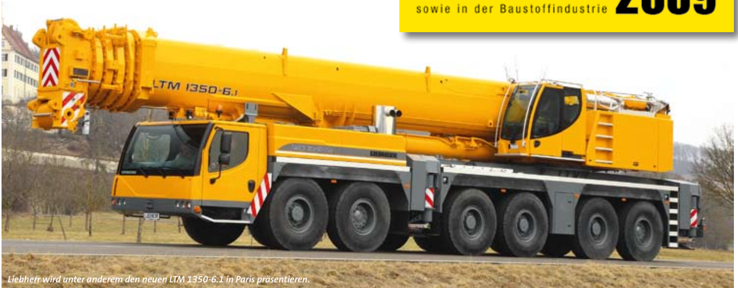
Liebherr wird unter anderem den neuen LTM 1350-6.1 in Paris präsentieren.

INTERMAT Internationale Fachmesse für Ausrüstungen und Verfahren im Hoch- und Tiefbau sowie in der Baustoffindustrie 2009