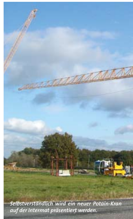
Selbstverständlich wird ein neuer Potain-Kran auf der Intermat präsentiert werden.