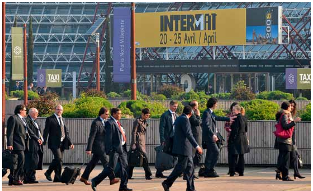
Mehr als 180.000 Fachbesucher zählte die Intermat 2009.

Auf jeden Fall aber wird Liebherr in Paris vertreten sein – und zwar auch mit einigen Premieren. So wird der Liebherr-Schnelleinsatzkran 65 K auf der Intermat 2012 in Paris erstmals der Öffentlichkeit präsentiert. Die Neukonstruktion des 65 K basiert auf dem erfolgreichen Konzept des vor zwei Jahren vorgestellten 81 K. Realisiert wurde eine Vielzahl von optimierten und weiterentwickelten Funktionen.