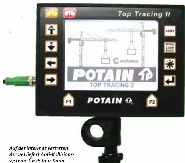
Auf der Intermat vertreten: Ascorel liefert Anti-Kollisions-systeme für Potain-Krane.

steht beim neuen 65-mt-Schnell-einsatzkran ebenfalls zur Verfügung. So können auch schwere Lasten ohne Einfallen der Hubwerksbremse absolut feinfühlig und millimetergenau positioniert werden. Die stufenlosen und besonders energieeffizienten FU-Antriebe aus dem Liebherr-eigenen Kompetenzzentrum tragen zum wirtschaftlichen Lastenumschlag bei.