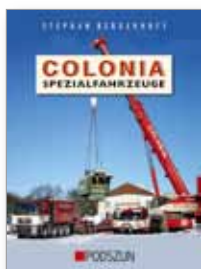
180 Seiten, 460 Abbildungen fester Einband, 29,90 EUR