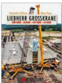
180 Seiten, 520 Abbildungen fester Einband, 29,90 EUR