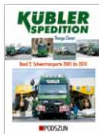
152 Seiten, 390 Abbildungen fester Einband, 24,90 EUR