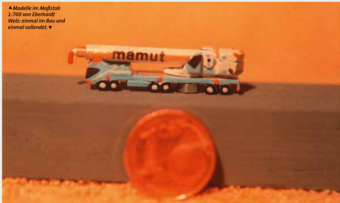
▲ Modelle im Maßstab 1:700 von Eberhardt Welz: einmal im Bau und einmal vollendet. ▼

Richtig filigran geht es zur Sache, wenn KM- und STM-Leser Eberhardt Welz zu Werke geht. Er baut seine Modelle im Maßstab 1:700, die zum Teil aber trotzdem noch über Funktionen verfügen. Diese Micro-Modell bestehen aus Gießharz sowie Plastik-Kleinteilen und sind komplette Eigenbauten. KM ■