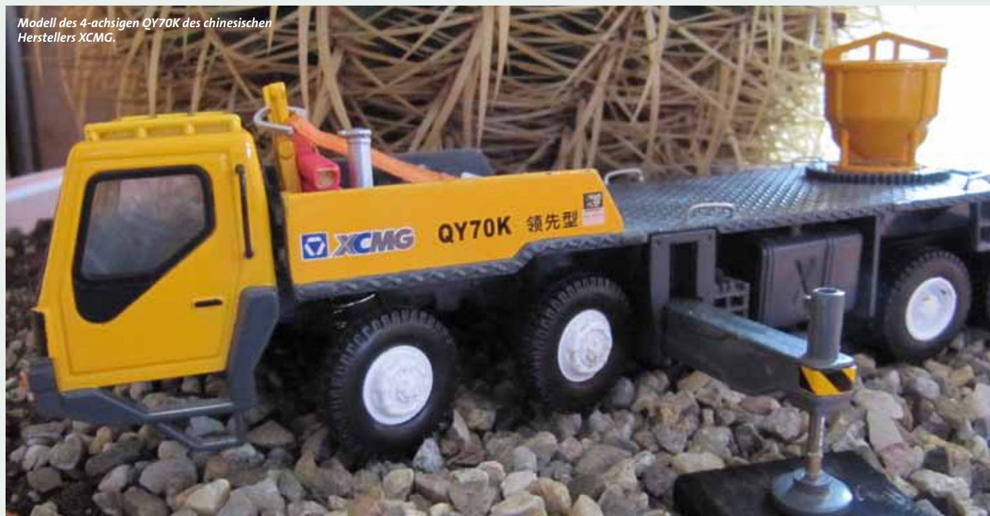
Modell des 4-achsigen QY70K des chinesischen Herstellers XCMG.