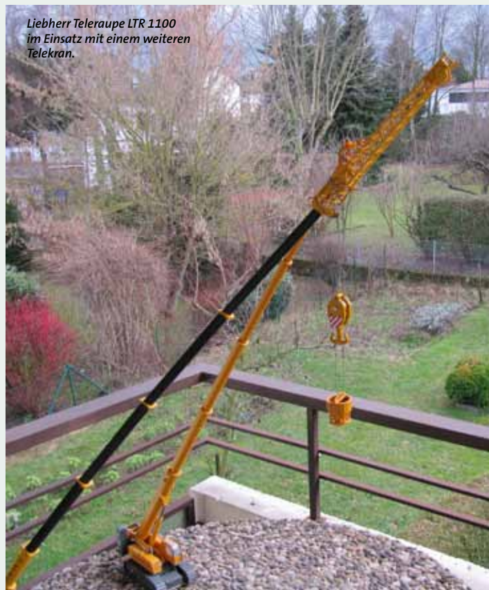
Liebherr Teleraupe LTR 1100 im Einsatz mit einem weiteren Telekran.

ner selbstentwickelten Kakteen-umtopfanlage im Maßstab 1:10, die eine Tragkraft von circa 100 kg bietet. Eine erste Anlage hatte sich bereits bis 20 kg bewährt.