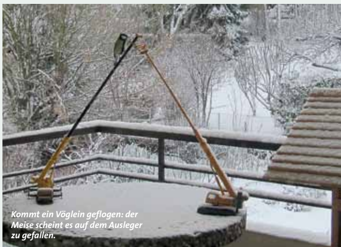
Kommt ein Vöglein geflogen: der Meise scheint es auf dem Ausleger zu gefallen.