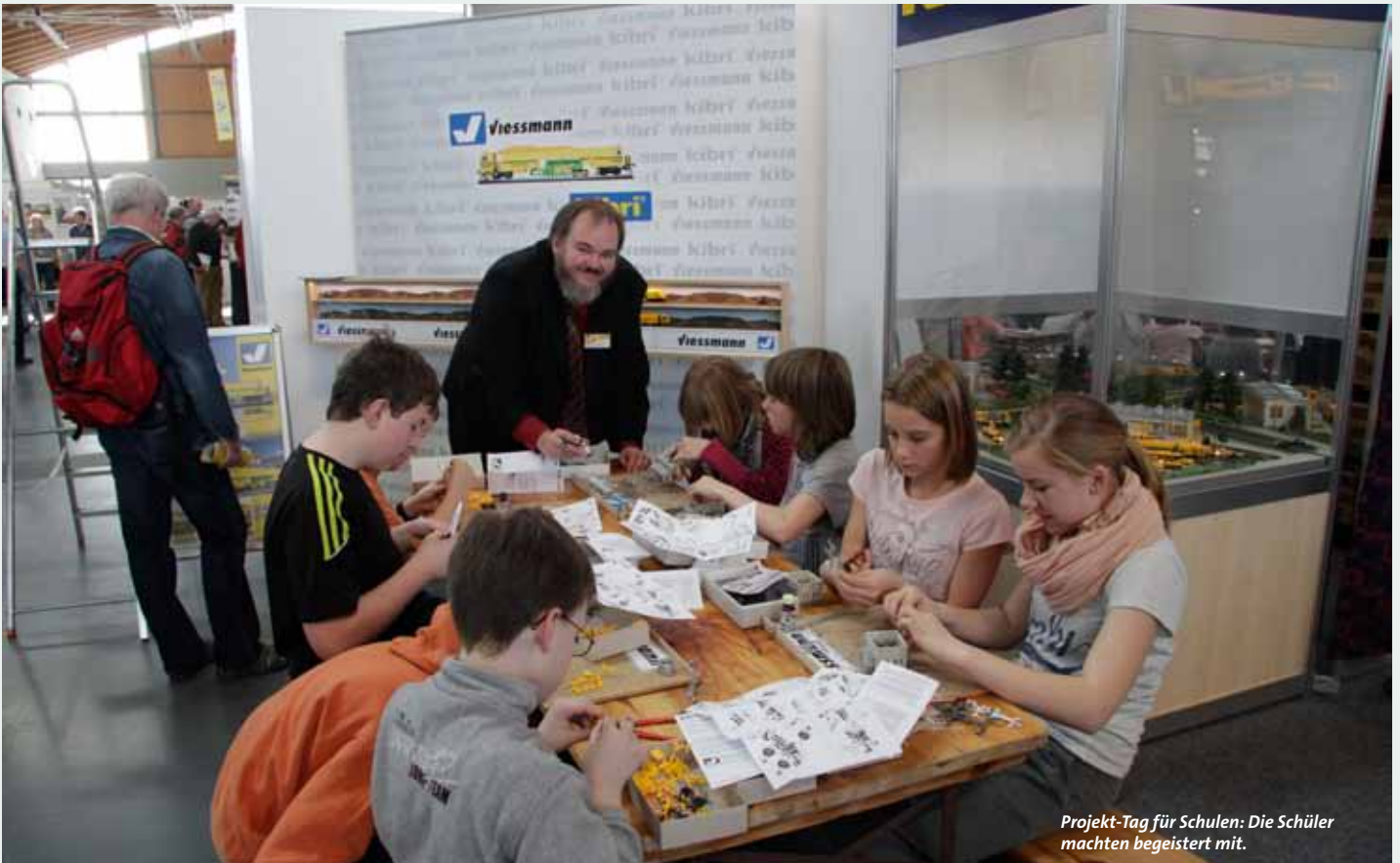
Projekt-Tag für Schulen: Die Schüler machten begeistert mit.

Modellsport pur gab es vom 22. bis 25. März in den Messehallen der Messe Karlsruhe zu erleben. Annähernd 50.000 Besucher kamen trotz Kaiserwetter, um in die Welt der Modelle einzutauchen.