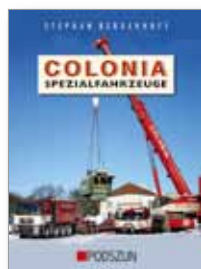
180 Seiten, 460 Abbildungen fester Einband, 29,90 EUR