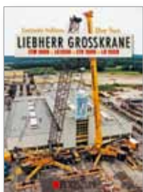
180 Seiten, 520 Abbildungen fester Einband, 29,90 EUR