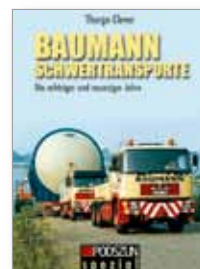
144 Seiten, 290 Abbildungen Leinenbroschur, 14,90 EUR