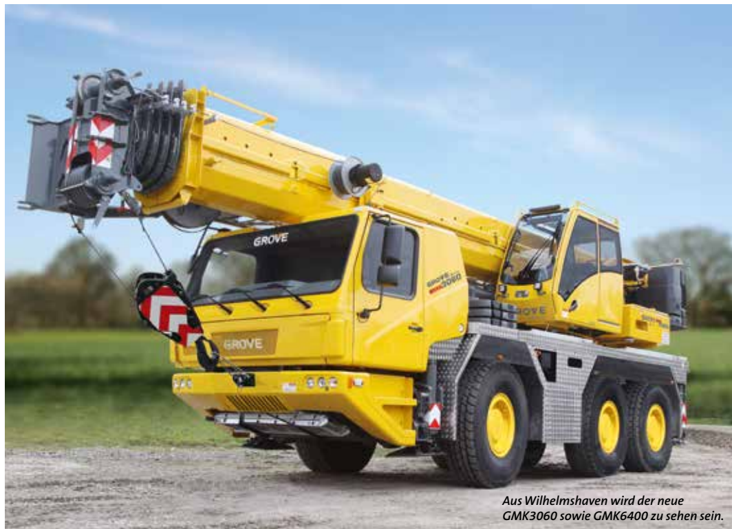
Aus Wilhelmshaven wird der neue GMK3060 sowie GMK6400 zu sehen sein.

Brandneu ist der GMK3060. Der 60-Tonner ist eine aktualisierte Ausführung des GMK3055. Dieser Kran ist mit dem neuen Manitowoc-Kransteuerungssystem (CCS) ausgerüstet. Ebenfalls mit dem Manitowoc CCS