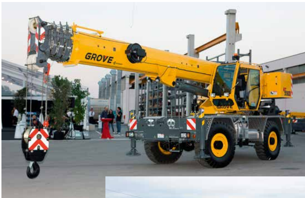
Manitowoc hat aus der Grove-Produkt-palette auch zwei neue RT-Krane angekündigt, außerdem einen „Yardboss“.

ausgerüstet ist der neue, auf dem Manitowoc-Stand ausgestellte Geländekran RT550E. Ein weiterer neuer Geländekran ist der RT770E. Dieser verfügt über