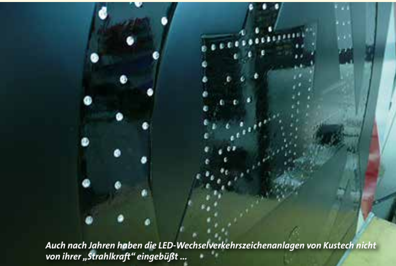
Auch nach Jahren haben die LED-Wechselverkehrszeichenanlagen von Kustech nicht von ihrer „Strahlkraft“ eingebüßt ...

dass die Lichtintensität im Laufe der Betriebszeit erheblich abnimmt und das ist natürlich nicht gewollt. Darüber hinaus könnte eine wiederholte Überprüfung gemäß der BAST-Richtlinien ergeben, dass die Anlage nicht mehr dieser Richtlinie entspricht.