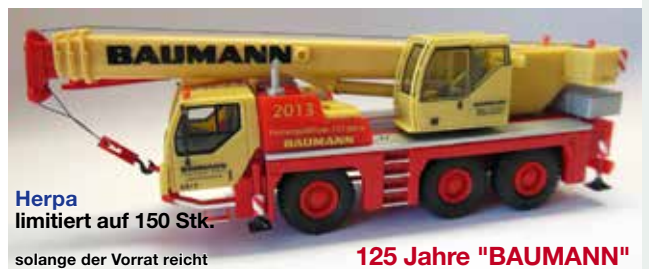
Herpa limitiert auf 150 Stk. solange der Vorrat reicht