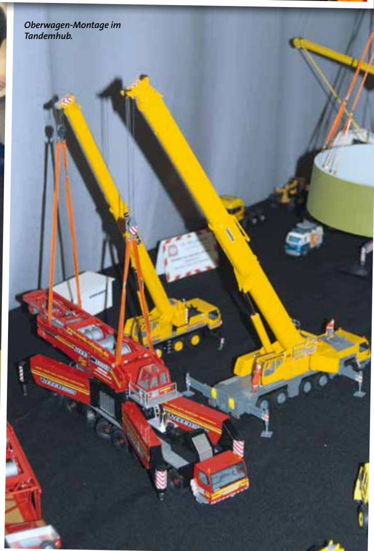
Oberwagen-Montage im Tandemhub.