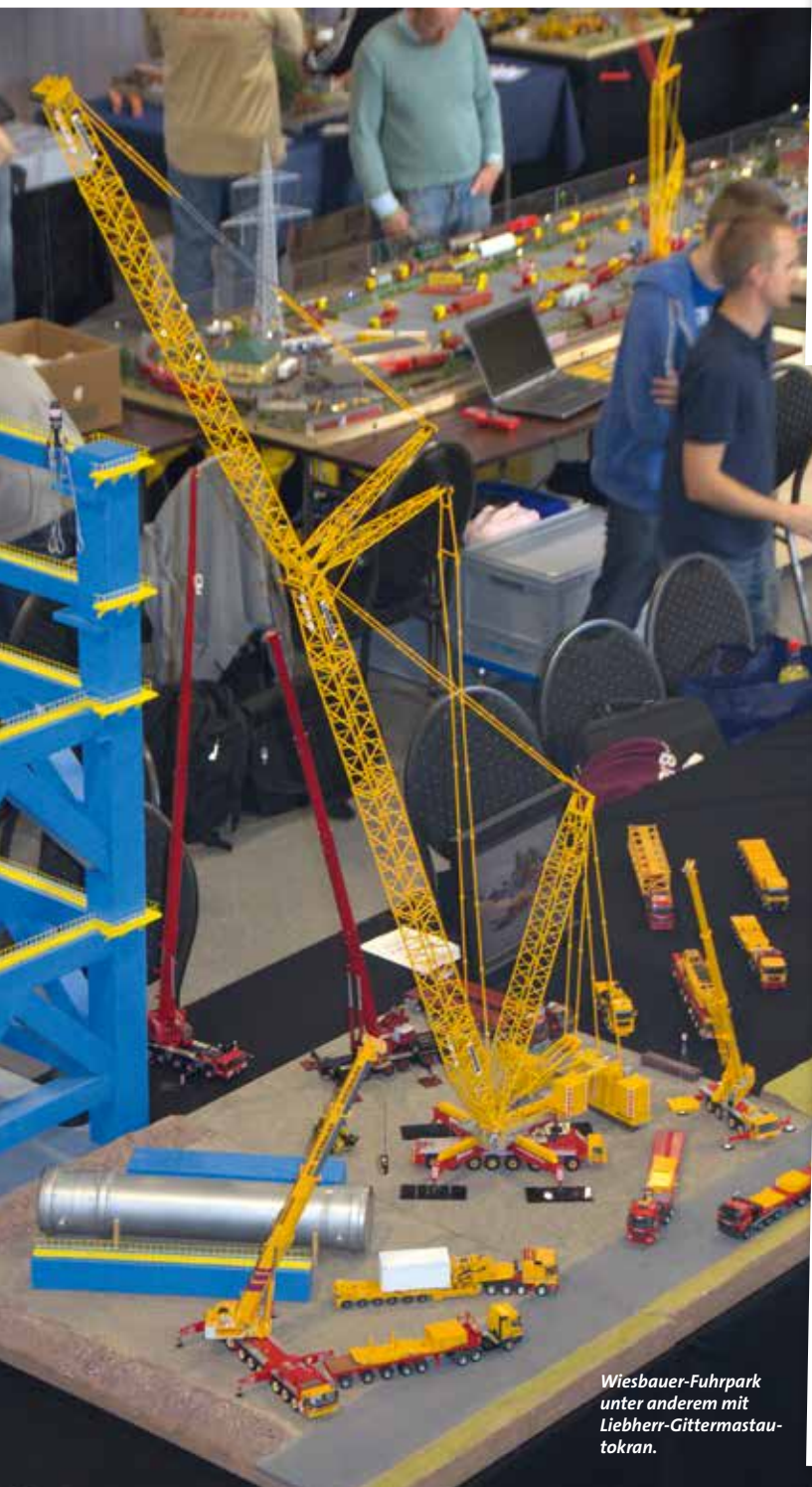
Wiesbauer-Fuhrpark unter anderem mit Liebherr-Gittermastautokran.