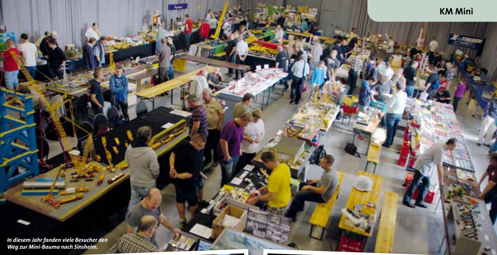
In diesem Jahr fanden viele Besucher den Weg zur Mini-Bauma nach Sinsheim.