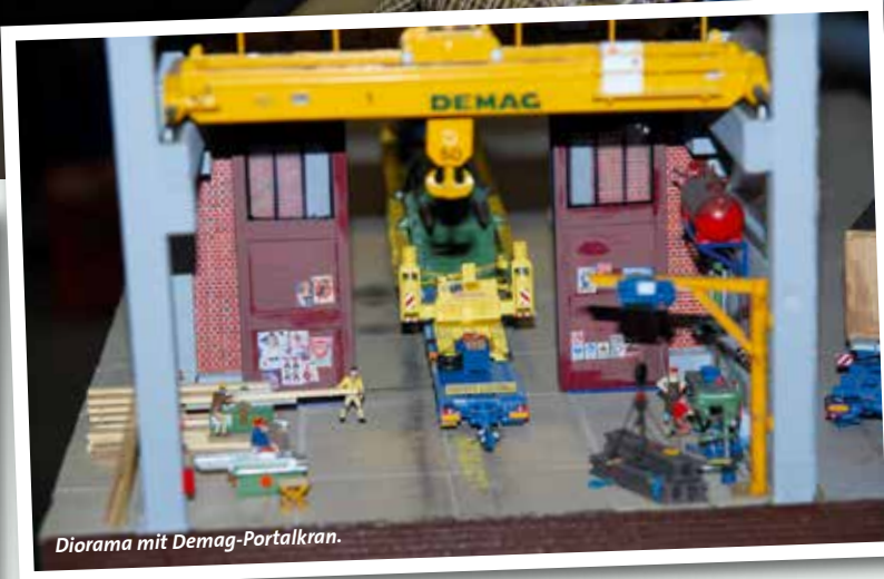
Diorama mit Demag-Portalkran.