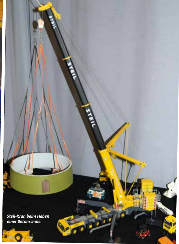
Steil-Kran beim Heben einer Betonschale.