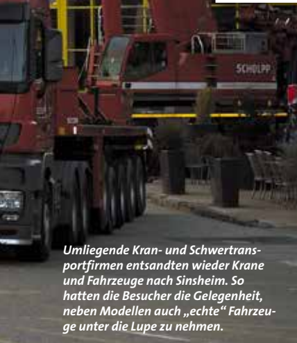
Umliegende Kran- und Schwertransportfirmen entsandten wieder Krane und Fahrzeuge nach Sinsheim. So hatten die Besucher die Gelegenheit, neben Modellen auch „echte“ Fahrzeuge unter die Lupe zu nehmen.

ter der Ausstellung erhalten – ein Umstand, der sowohl von Ausstellern wie auch Besuchern geschätzt wird, und deshalb kommt man gerne auch für zwei Tage.