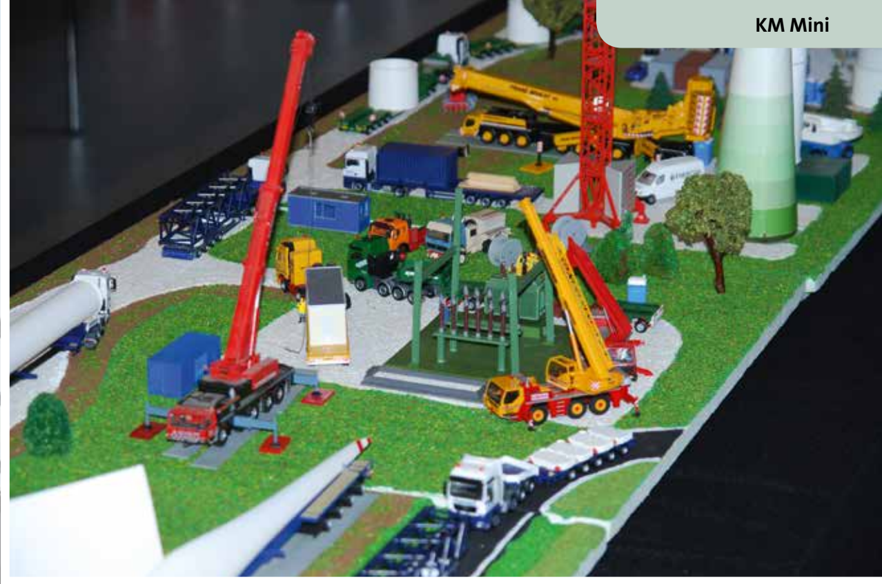
Auch der Nachwuchs präsentierte sich auf der Mini-Bauma in Sinsheim. Unter anderem zeigte Mirko Schulte ein Diorama zum Thema Windkraft.