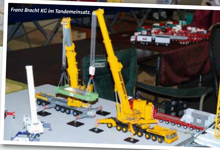
Franz Bracht KG im Tandemeinsatz.