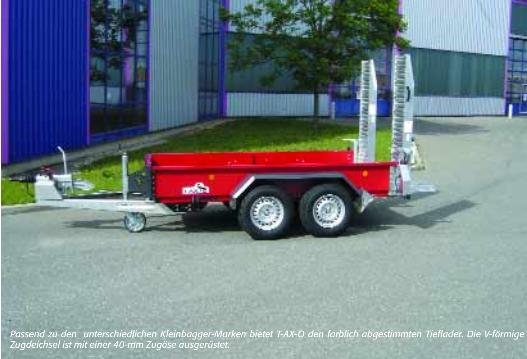
Passend zu den unterschiedlichen Kleinbagger-Marken bietet T-AX-O den farblich abgestimmten Tieflader. Die V-förmige Zugdeichsel ist mit einer 40-mm Zugöse ausgerüstet.