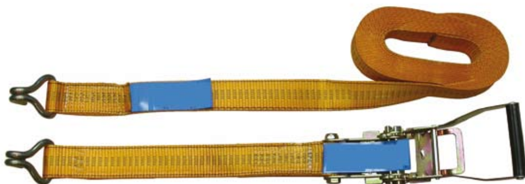
Gurt nach Norm.

ihre Aufgabe bewältigen zu können. Im Detail sind Festigkeiten von Haken und Ratschen beschrieben, die Bruchkraft und Dehnung von Gurtbändern sind je nach Zurrgurtyp exakt vorgeschrieben. Und – besonders wichtig: Wesentliche