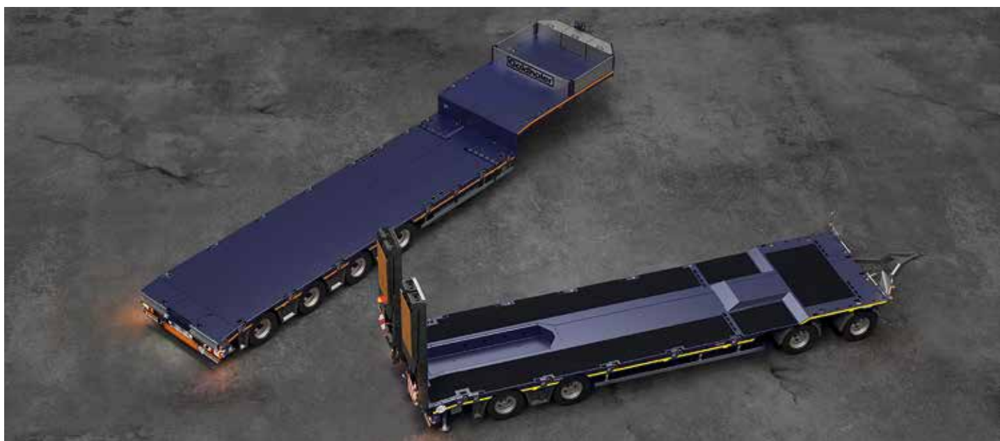
... auch den neuen »TRAILSTAR«.

Goldhofer präsentiert den »STEPSTAR« und den neuen »TRAILSTAR«, beide in vierachsiger Ausführung, auf der IAA Transportation in Halle 25, Stand C07.