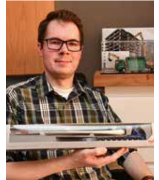
Gewinnerfotos des letzten Jahres.