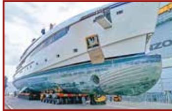
3 Seite 40, Cometto