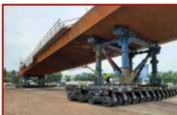
13 Seite 44, Cometto