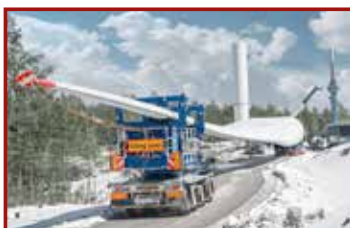
17 Seite 45, TII SCHEUERLE