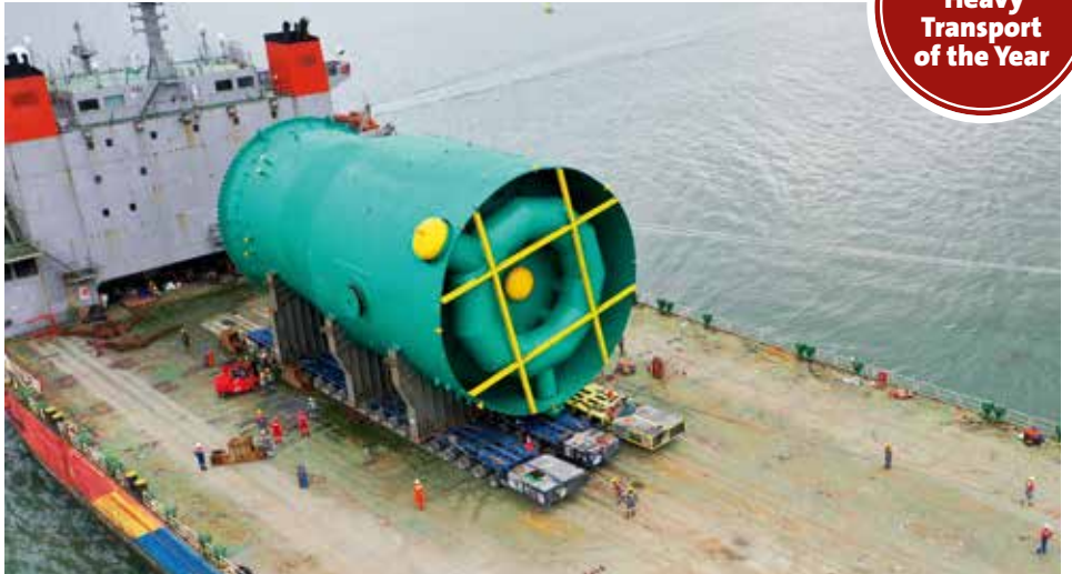
Transport des 1.357 t schweren Regenerators auf 3x20 PST/SL Achslinien.

www.kranmagazin.de/ArchivSTM/Stm_103/spezial2.pdf