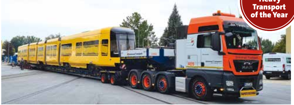
Für den sicheren Transport kam eine spezielle Schienenfahrzeuglösung von Goldhofer zum Einsatz.

www.kranmagazin.de/ArchivSTM/Stm_104/aktion6.pdf