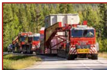
19 Seite 46, Mammoet