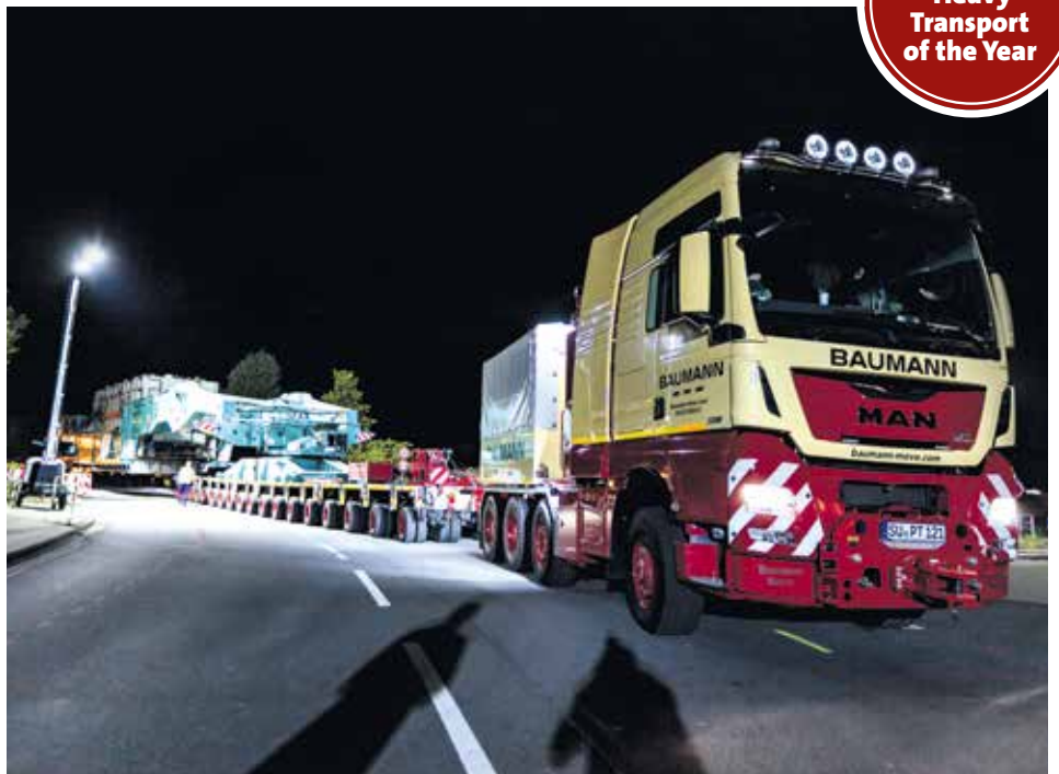
Auf dem ersten Teilstück der Strecke gab es für das lange Gespann – bestehend aus einem MAN TGX 41.640, der Scales-Scherenhub-Kesselbrücke auf zwei 18-achsigen Fahrwerken und einem weiteren MAN TGX 41.640 als Schubfahrzeug – genug Platz auf und neben der zweispurigen Straße.

www.kranmagazin.de/ArchivSTM/Stm_108/aktion4.pdf