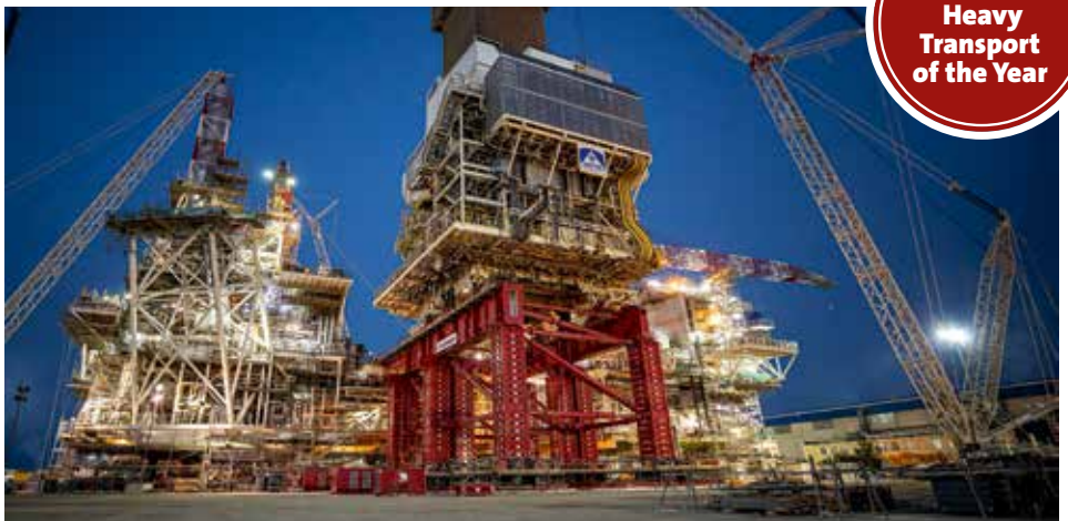
Insgesamt 120 Achslinien von SPMT transportierten die Module bis zur Plattform.

Die kreative Ingenieurskunst und innovative Ausrüstung von Mammoet sorgen für einen sicheren und effizienten Betrieb beim Bau der Produktions-, Bohr- und Quartiersplattform Azeri Central East (ACE) im Kaspischen Meer. Die Planung begann im Jahr 2019, noch vor der Fertigung, als Mammoet beauftragt wurde, die detaillierte technische Studie für die Integration der Module durchzuführen, die alle Anforderungen für den Schwerlasthub, Bewegungs- und Stabilitätsberechnungen sowie Risikobewertungen abdeckt. Später, im Jahr 2022, wurde Mammoet ausgewählt, um die physische, praktische Integration durchzuführen. Der Umfang umfasste das Wiegen, Transportieren, Heben und Verschieben des 2.400 t schweren DES-Moduls – das 32 m lang, 22 m breit und 80 m hoch war – und des 2.350 t schweren MDSM-Moduls – das 43 m lang, 20 m breit und 20 m hoch war. Dies