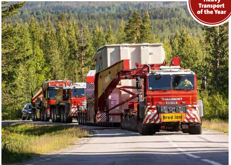
Steigungen waren für den Trojan-Truck kein Problem.

www.kranmagazin.de/ArchivSTM/Stm_108/aktion2.pdf