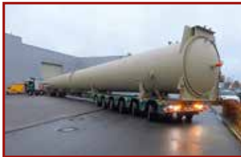
5 Seite 41, Broshuis/ Bolk Transport