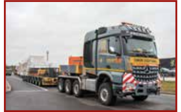
4 Seite 41, Friderici