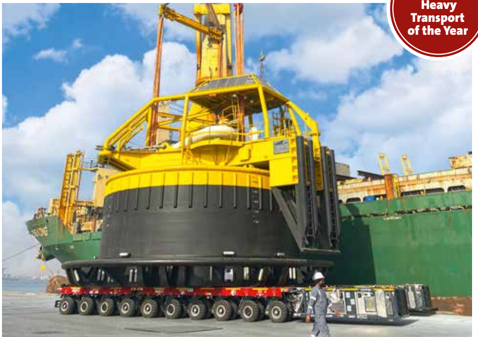
Bis zu 336,6 Tonnen lasten auf den SPMTs.

www.kranmagazin.de/ArchivSTM/Stm_105/aktion3.pdf