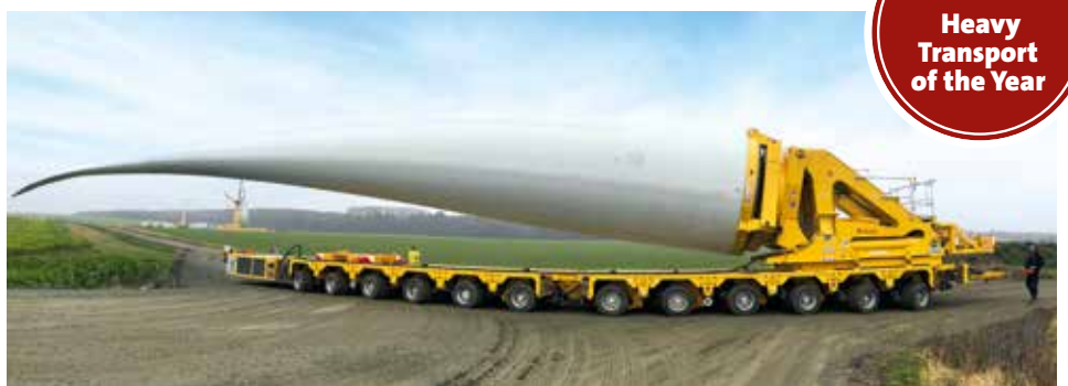
Zum Einsatz kam eine InterCombi Selbstfahrerkombination aus zwei Mal sechs Achslinien sowie der Rotorblattadapter G4.

Der Transport von 79 Meter langen Rotorblättern über Land birgt ganz besondere Herausforderungen. Um diese zu bewältigen vertraute Steil Kranarbeiten auf den Rotorblattadapter von TII SCHEUERLE. Die neue, vierte Generation bietet nochmals optimierte technische Qualitäten, die sich bei diesem Transport beweisen mussten. Enge Ortsdurchfahrten, dicht bepflanzte Alleen, niedrige Starkstromleitungen und einige Schikanen mehr – die rund sechs Kilometer lange Strecke vom Ladeplatz bei Cramme östlich von Salzgitter zum Windpark Flöthe ist gespickt mit Hindernissen. Über diese Route musste Steil Kranarbeiten für einen namhaften Hersteller von Windenergieanlagen mehrere