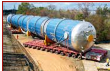
11 Seite 43, Goldhofer/Mammoet