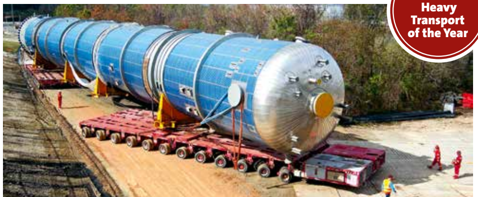
Über insgesamt 32 km transportierten die Schwerachslinien die großen Reaktorkessel.

Insgesamt 7 Reaktorkessel für eine Raffinerieanlage hatte der Schwerlastspezialist Mammoet von Houston nach Pasadena/TX in eine Ethylen Anlage zu transportieren. Die aus Spanien eintreffenden Kessel wurden im Hafen von Houston/TX umgeschlagen und auf eine Goldhofer-Nachläuferkombination mit Selbstfahrern geladen. Zum Einsatz kamen dabei 48 der bewährten Schwerlastachslinien vom Typ PST/SL und THP/SL. Diese wurden in Parallelkombinationen (1+1) mit je 24 Achslinien und einem Drehschemel mit 300 t angeordnet. Der größte der 7 Raffineriekessel, ein sogenannter Deisobutanizer mit einem Gewicht von über 440 t, einem Durchmesser von 6,5 m und einer Länge von 60,5 m forderte nicht nur das Können des