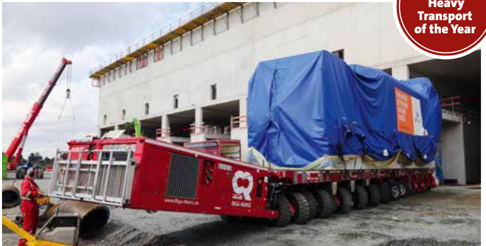
Mit 90 Grad Schwenk vor die Einfahrt des Maschinenhauses.

www.kranmagazin.de/ArchivSTM/Stm_103/spezial4.pdf