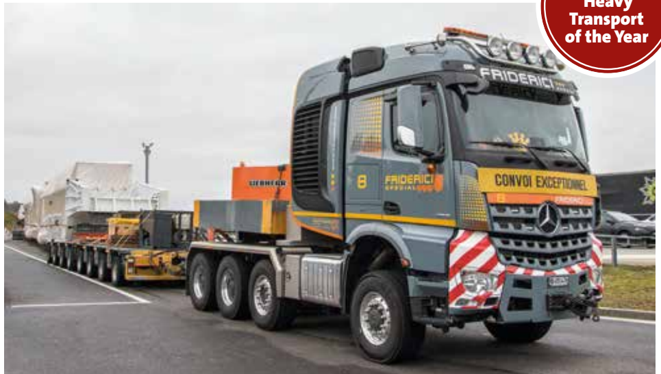
Transport des 1.357 t schweren Regenerators auf 3x20 PST/SL Achslinien.

www.kranmagazin.de/ArchivSTM/Stm_103/aktion1.pdf