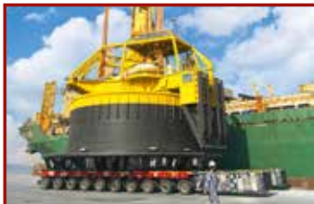
9 Seite 42, Cometto