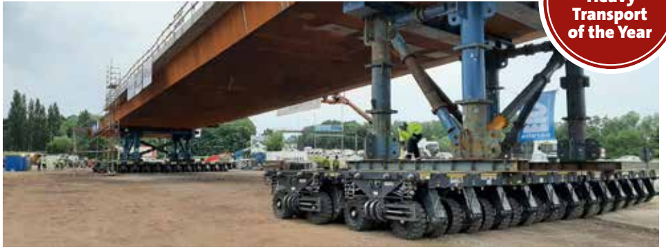
Die 105 m lange, 17 m breite und 1.000 t schwere Brücke liegt auf den Hubsystemen, die auf den beiden 24 Achslinien Cometto MSPE montiert sind.

www.kranmagazin.de/ArchivSTM/Stm_107/titelstory.pdf