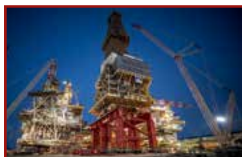
18 Seite 45, Mammoet