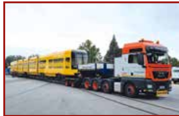
7 Seite 42, Goldhofer/ Universal Transport