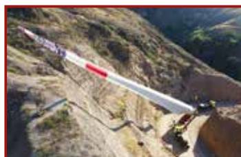
15 Seite 44, Goldhofer