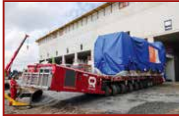
2 Seite 40, Riga Mainz/ TII SCHEUERLE