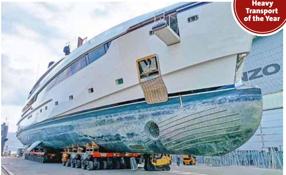
Unterhaltsprogramm für eine 1.100-Tonnen-Yacht auf Landgang.

www.kranmagazin.de/ArchivSTM/Stm_103/spezial6.pdf