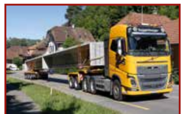
16 Seite 45, Toggenburger/Doll