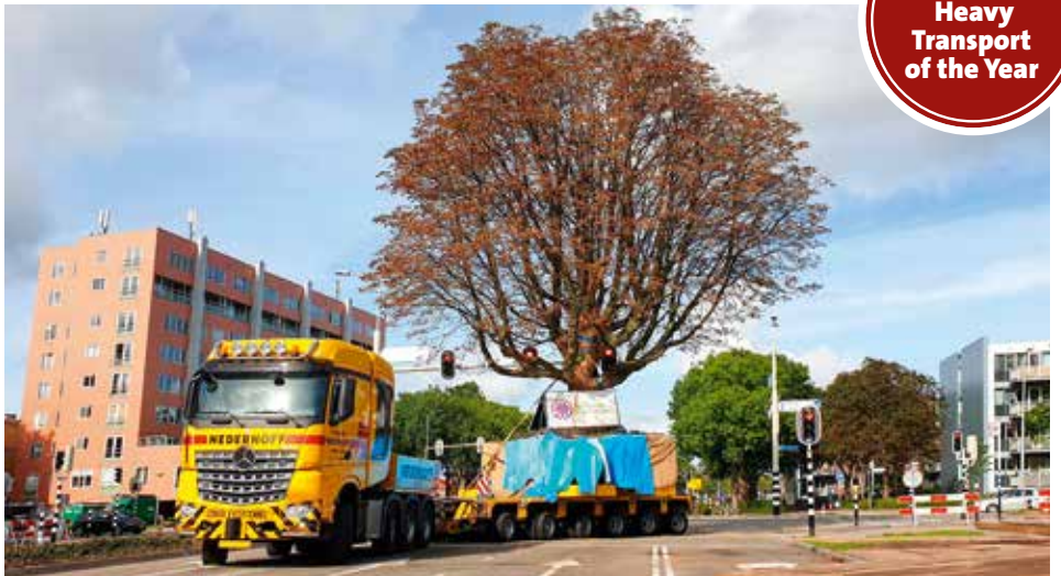
Während des Transports mussten Bordsteine überquert und Straßenlaternen sowie Ampelanlagen ausgewichen werden.

www.kranmagazin.de/ArchivSTM/Stm_105/aktion1.pdf