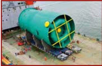
1 Seite 40, Goldhofer