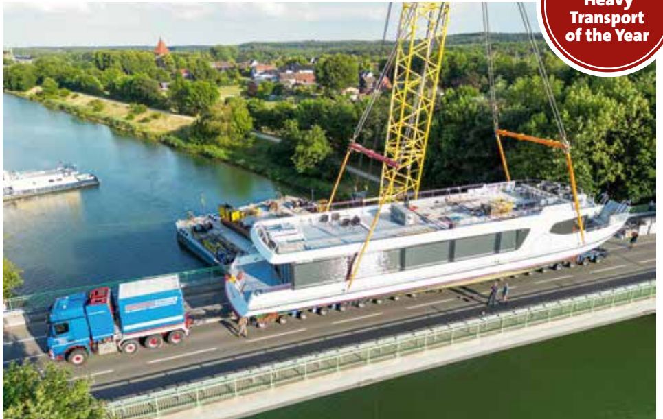
Das Ausflugsschiff ist sicher auf dem Trailer gelandet.

www.kranmagazin.de/ArchivSTM/Stm_107/aktion1.pdf