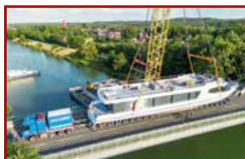
14 Seite 44, Hegmann Transit