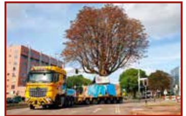
8 Seite 42, Faymonville/Nederhoff