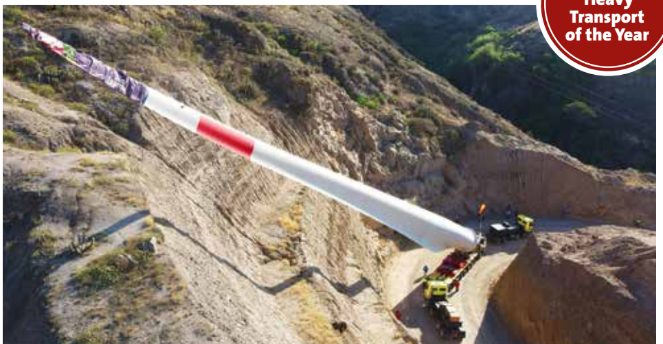
Aufgestellter Windflügel: so kann der Transport mit dem Goldhofer FTV 550 die Kurve mit dem Berg Rücken problemlos meistern.

www.kranmagazin.de/ArchivSTM/Stm_107/aktion2.pdf