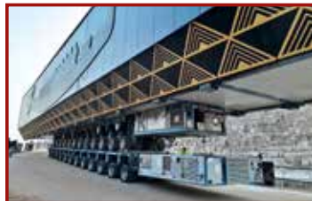
10 Seite 43, Sarens/TII KAMAG