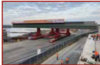
6 Seite 41, Mammoet