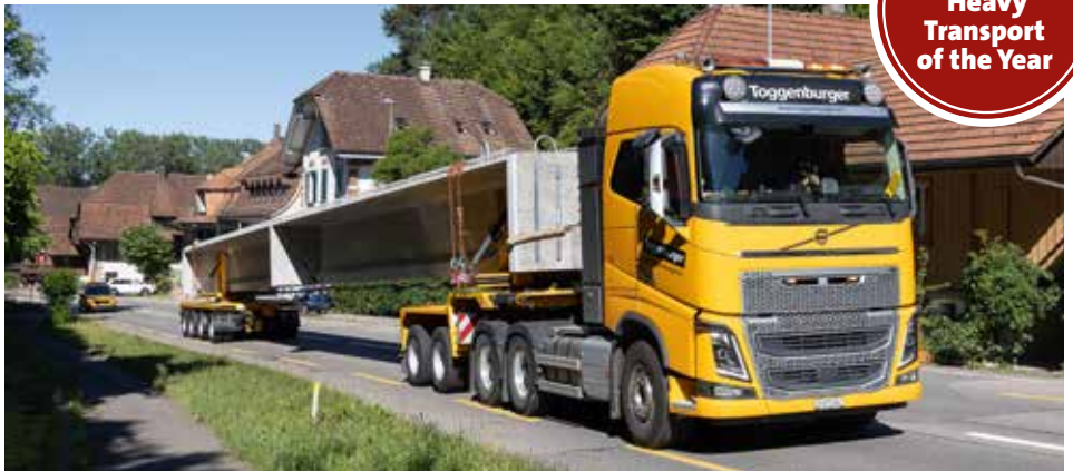
Gümmenen Richtung Mühleberg – volle Leistung den Berg hoch.

www.kranmagazin.de/ArchivSTM/Stm_107/aktion3.pdf