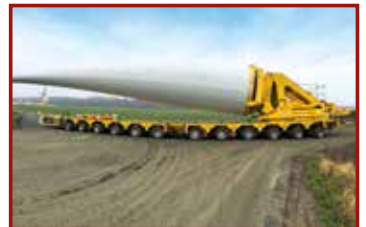
12 Seite 43, TII SCHEUERLE/ Steil Kranarbeiten