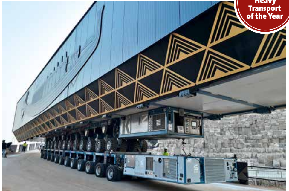
Die zwölf K24 Achslinien sind mit der kostbaren Fracht auf den zwölf K25 SPE Achslinien abgestellt.

www.kranmagazin.de/ArchivSTM/Stm_105/titelstory.pdf