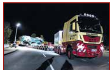
20 Seite 46, Baumann/Greiner/ TII SCHEUERLE