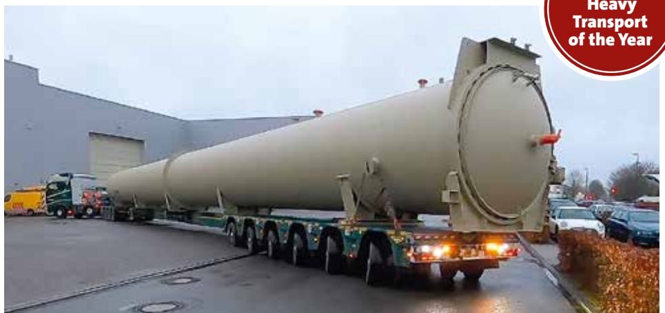
Der Transport setzt sich in Richtung Zielort in Bewegung.

www.kranmagazin.de/ArchivSTM/Stm_104/aktion1.pdf