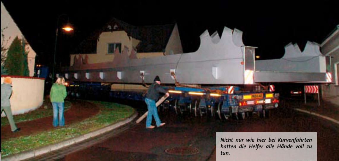
Nicht nur wie hier bei Kurvenfahrten hatten die Helfer alle Hände voll zu tun.