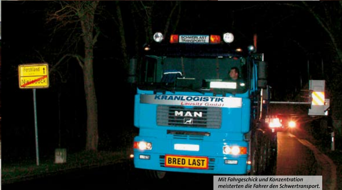
35 m lang waren die Brückenteile, die nachts von Dresden nach Parey transportiert werden mussten.