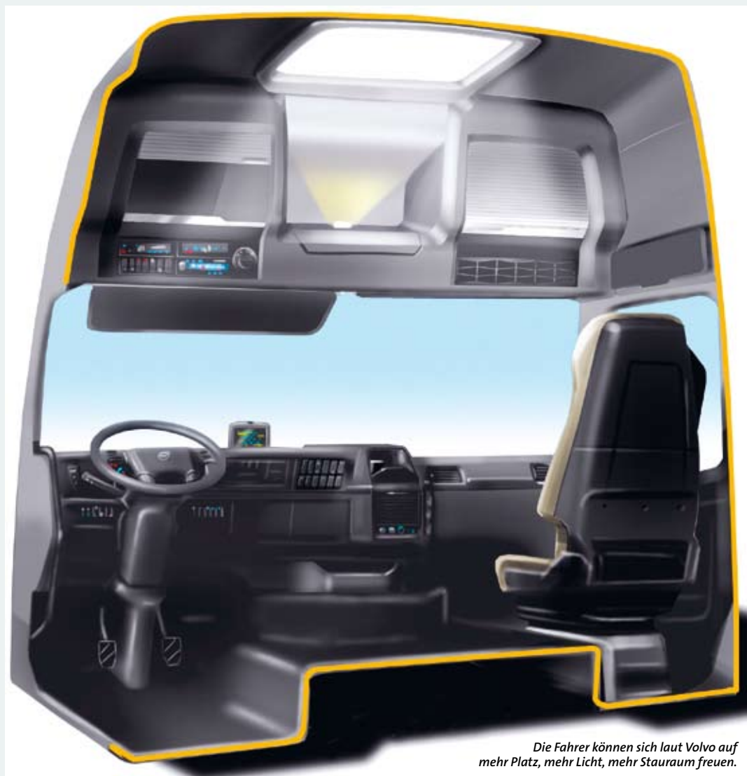
Die Fahrer können sich laut Volvo auf mehr Platz, mehr Licht, mehr Stauraum freuen.