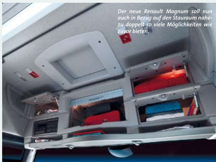
Der neue Renault Magnum soll nun auch in Bezug auf den Stauraum nahezu doppelt so viele Möglichkeiten wie zuvor bieten.