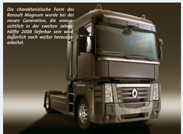
Die charakteristische Form des Renault Magnum wurde bei der neuen Generation, die voraussichtlich in der zweiten Jahreshälfte 2008 lieferbar sein wird, äußerlich noch weiter herausgearbeitet.