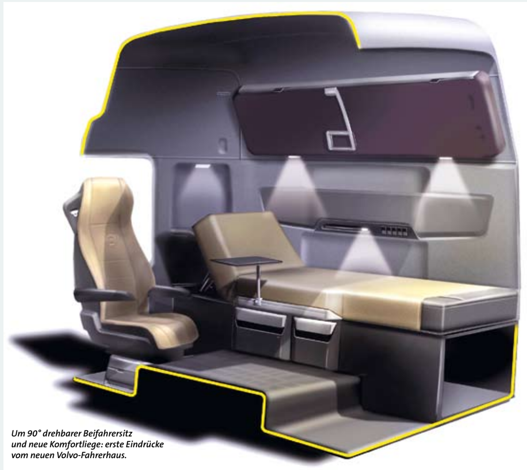
Um 90° drehbarer Beifahrersitz und neue Komfortliege: erste Eindrücke vom neuen Volvo-Fahrerhaus.

Für mehr Entspannung während der Ruhephasen sorgt die breitere und höher positionierte Liege mit verstellbarer Rückenlehne. Der Beifahrersitz ist um 90° drehbar und lässt sich um 15° nach hinten neigen. 17 Lichtquellen inklusiver moderner Beleuchtungssteuerung und Dimmer setzen darüber hinaus die Kabine ins rechte Licht. Zu den weiteren Neuerungen zählen Regensensoren für die Scheibenwischer und die Ausstattung mit Abbieglicht.