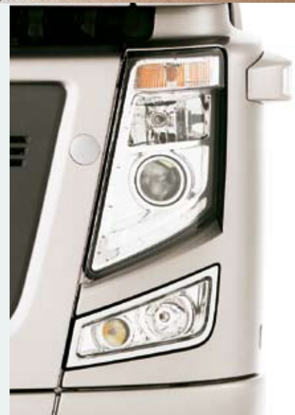
Abbiegescheinwerfer verbessern die Ausleuchtung beim Abbiegen und in Kurven.

während eine 140 mm dicke dreilagige Matratze für einen erholsamen Schlaf sorgen soll. Der Magnum bietet viele Neuerungen, die die täglichen Arbeitsabläufe erleichtern, wie beispielsweise das Optidriver+-Getriebe mit Bedienschalter am Lenkrad oder die elektrischen Fensterheber mit Finger-Tipp Bedienung, deren Betätigung die Konzentration auf den Verkehr nicht einschränkt.