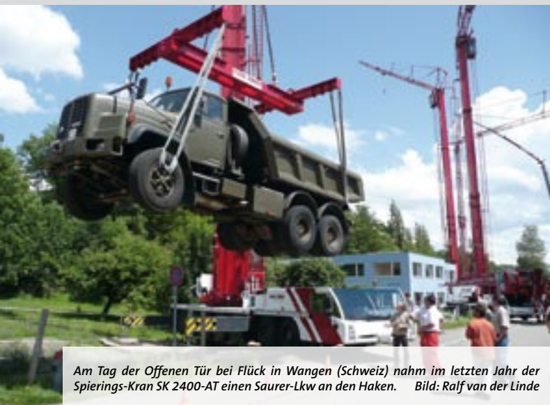
Am Tag der Offenen Tür bei Flück in Wangen (Schweiz) nahm im letzten Jahr der Spierings-Kran SK 2400-AT einen Saurer-Lkw an den Haken.

Datum: Samstag, 14.06.08 Zeit: 10.00 bis 16.00 Uhr Wo: CH-9425 Thal (Schweiz) am Bodensee Infos/Anfahrt: www.baumaschinenmodelle.ch hjb@baerlocher-natursteine.ch