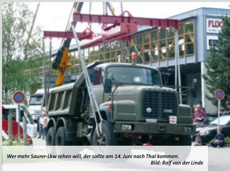
Wer mehr Saurer-Lkw sehen will, der sollte am 14. Juni nach Thal kommen.