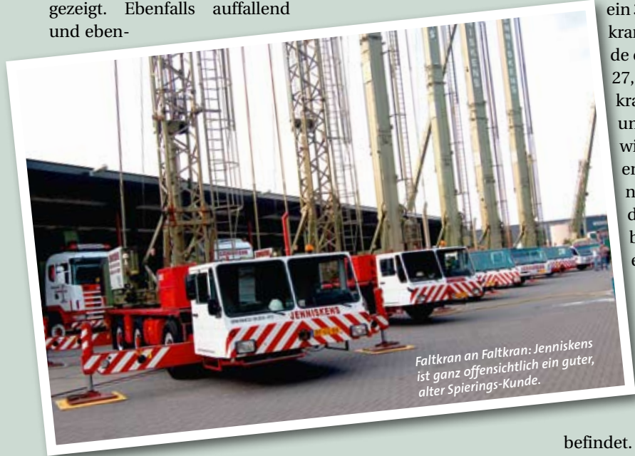
Faltkran an Faltkran: Jenniskens ist ganz offensichtlich ein guter, alter Spierings-Kunde.