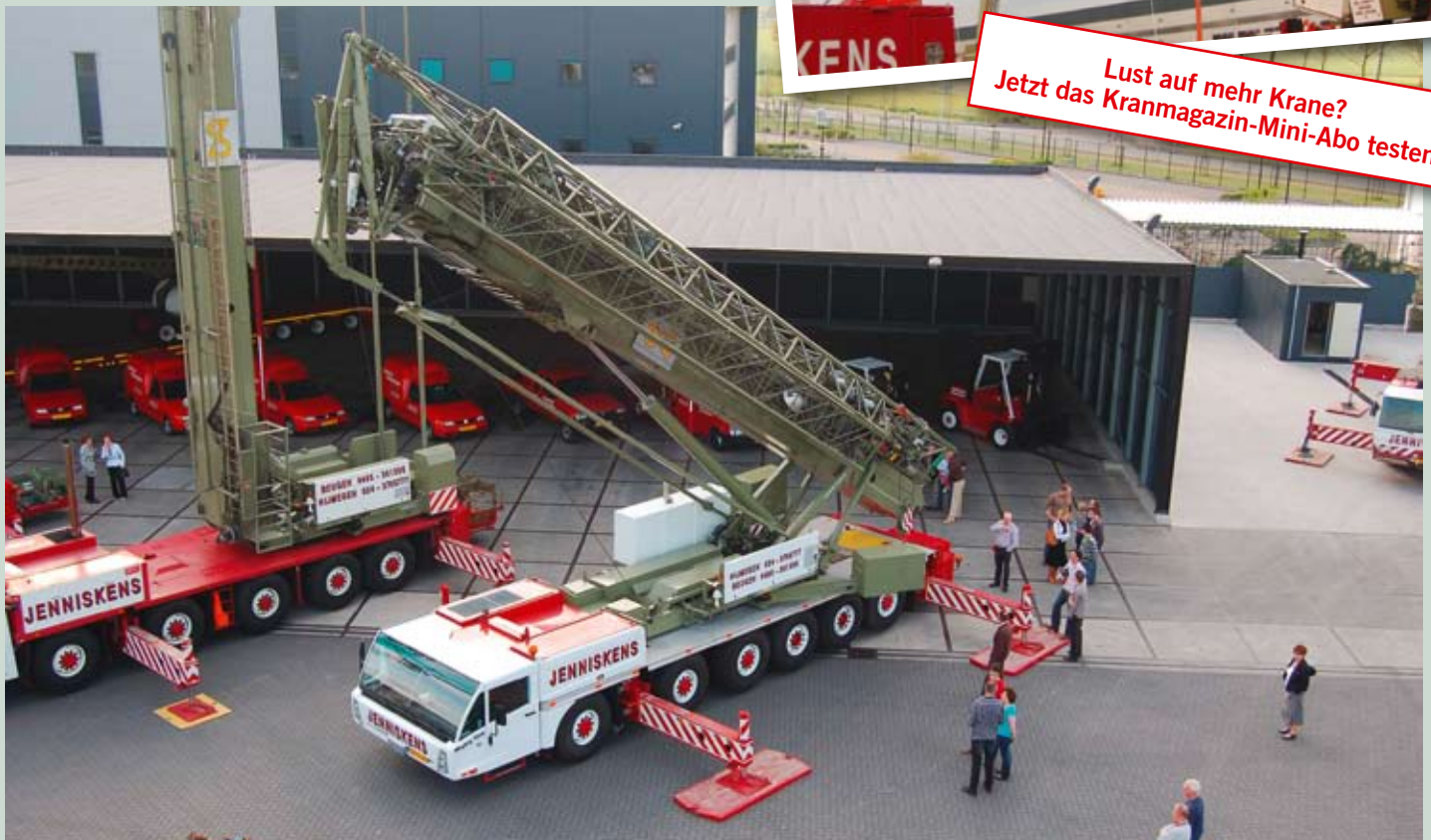
Die Krandemonstration mit dem Spierings-6-Achser kam bei den Besuchern gut an.

Lust auf mehr Krane? Jetzt das Kranmagazin-Mini-Abo testen!