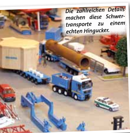
Die zahlreichen Details machen diese Schwertransporte zu einem echten Hingucker.