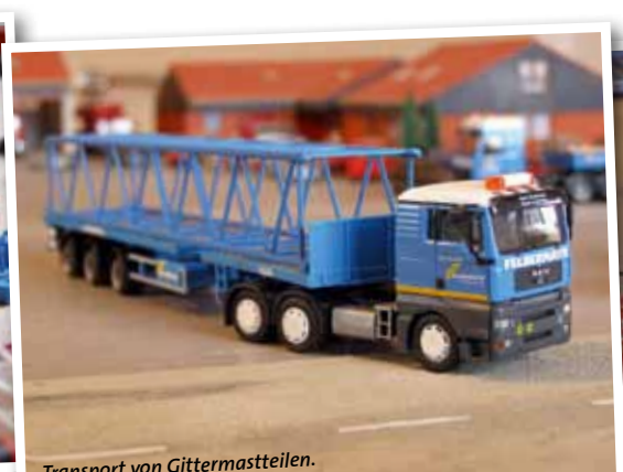
Transport von Gittermastteilen.