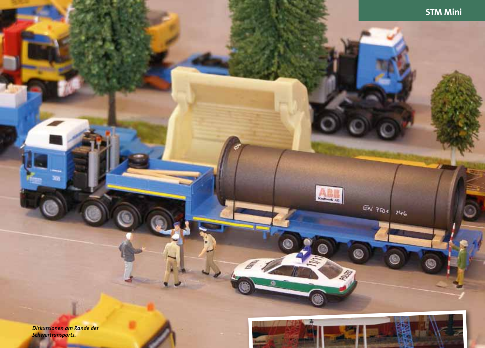
Diskussionen am Rande des Schwertransports.

Für das Hafenninnenbecken kamen „Betonplatten“ von Kibri zum Einsatz, die passgenau zugeschnitten wurden. Strukturglas, das farblich entsprechend bearbeitet wurde, dient im Hafenbecken als täuschend echte Imitation der Wasseroberfläche.