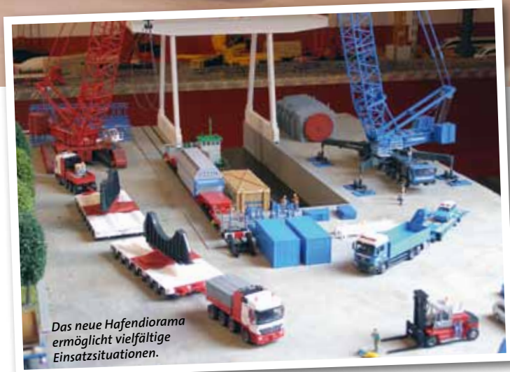
Das neue Hafendiorama ermöglicht vielfältige Einsatzsituationen.

litäten gerüstet sein. Und so wurde dem Hafendiorama schließlich noch ein eigener Schienenstrang spendiert. Das passt nicht nur zum Thema Trimodaler Schwerlasttransport, sondern auch schön zum Maßstab 1:87. STM