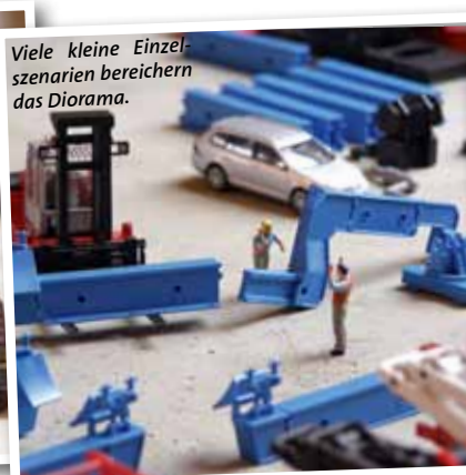
Viele kleine Einzelszenarien bereichern das Diorama.