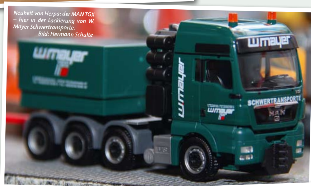
Neuheit von Herpa: der MANTGX – hier in der Lackierung von W. Mayer Schwertransporte.

Durchführung der beliebten FMT-Neuheiten-Flugschau in direkter Nachbarschaft, so der Veranstalter. An dem bewährten Erlebnismix aus spektakulären Shows, informativen Vorführungen und attraktiven Sonderschauen soll sich aber auch zukünftig nichts ändern.