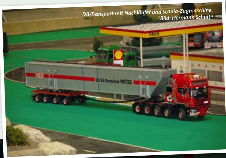
DB-Transport mit Nachläufer und Scania-Zugmaschine.