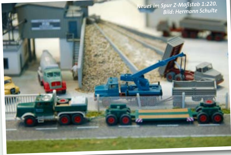
Neues im Spur Z-Maßstab 1:220.