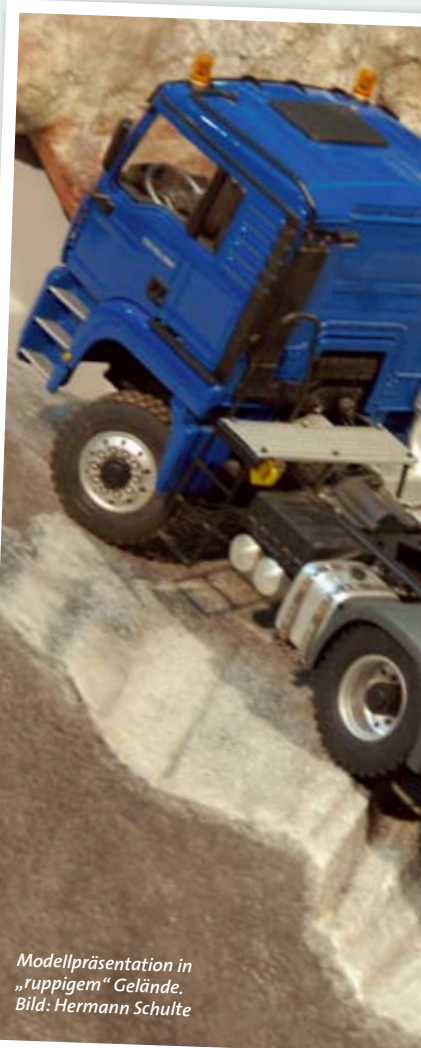
Modellpräsentation in „ruppigem“ Gelände.

Standort Karlsruhe konnte laut Veranstalter vor allem durch das Fluggelände, das direkt am Messegelände liegt, punkten. Hier findet die Faszination Modellbau genügend Raum zur Entfaltung und ermöglicht die