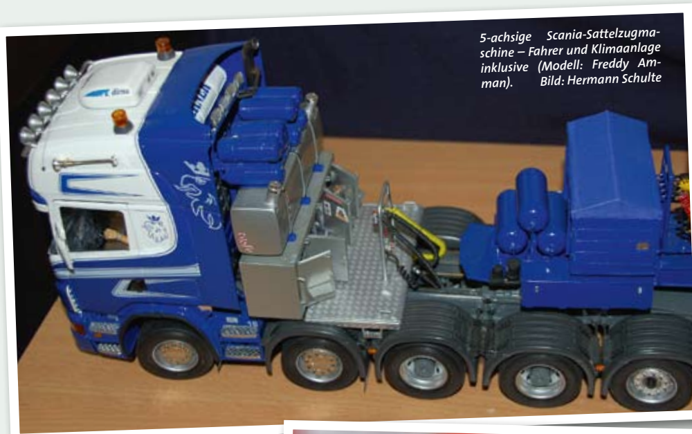
5-achsige Scania-Sattelzugmaschine – Fahrer und Klimaanlage inklusive (Modell: Freddy Amman).

Wer sich für Truckmodellbau, Krane und Schwertransporte interessiert, kam in diesem Jahr wieder in Halle 4 auf seine Kosten. Unter anderem stellte dort die IGFBKS aus, die sich auch wieder aktiv an dem Projekttag der Schulen beteiligte. 22 Kinder wurden in diesem Jahr mit dem Modellbau vertraut gemacht, und am Ende konnten alle erfolgreich zusammengebaute Modelle mit an ihre Schulen mitnehmen.