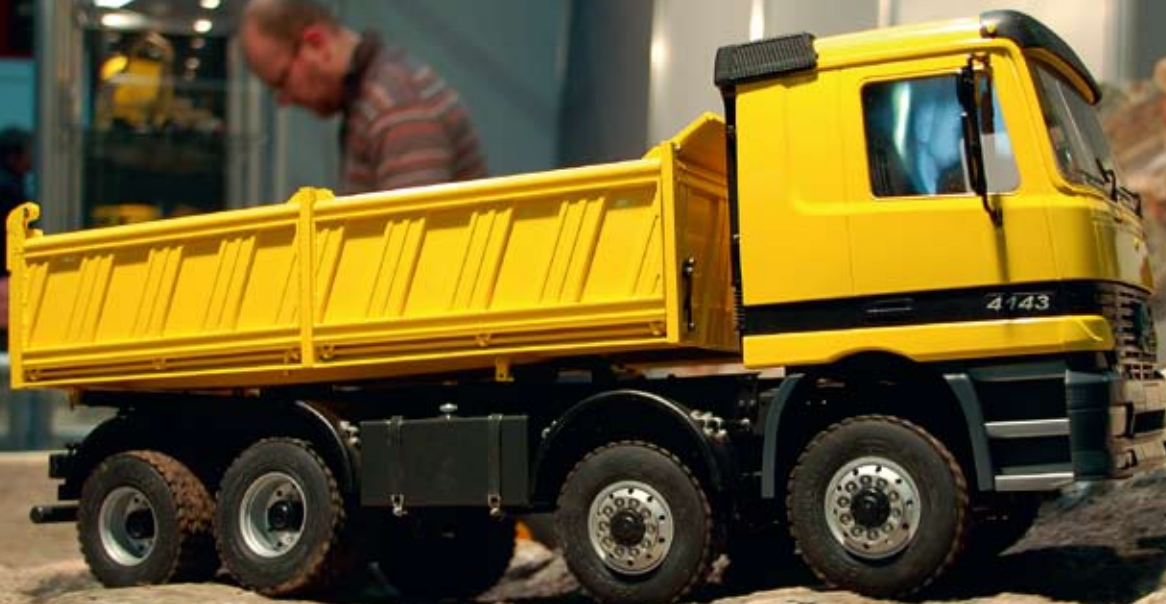
Hier ist der Kipper in seinem Element.