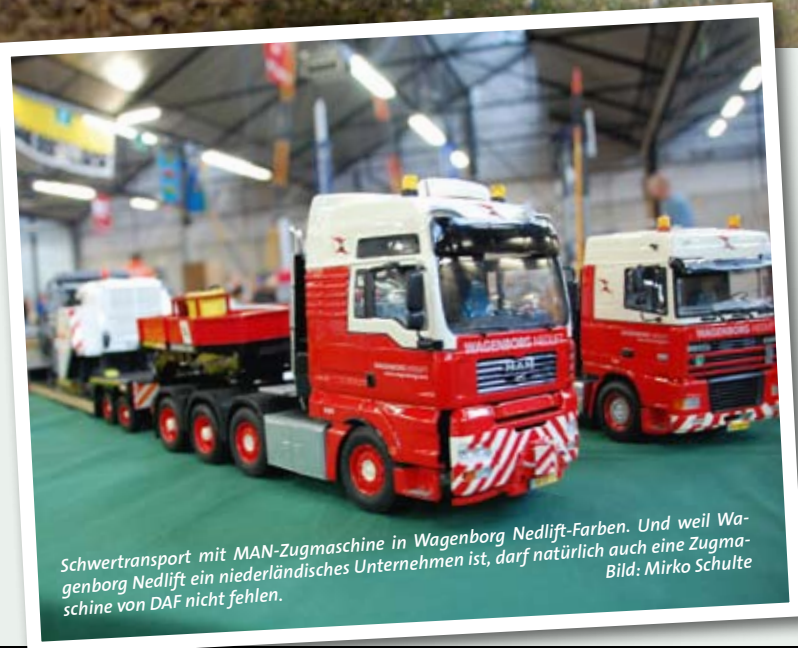
Schwertransport mit MAN-Zugmaschine in Wagenborg Nedlift-Farben. Und weil Wagenborg Nedlift ein niederländisches Unternehmen ist, darf natürlich auch eine Zugmaschine von DAF nicht fehlen.

Für viele Modellbauer, die sich den Bereichen Krane, Schwertransporte und Baumaschinen widmen, ist die Modelshow Europe darum ein fester Bestandteil ihrer Jahresplanung. Denn die Veranstaltung, die in