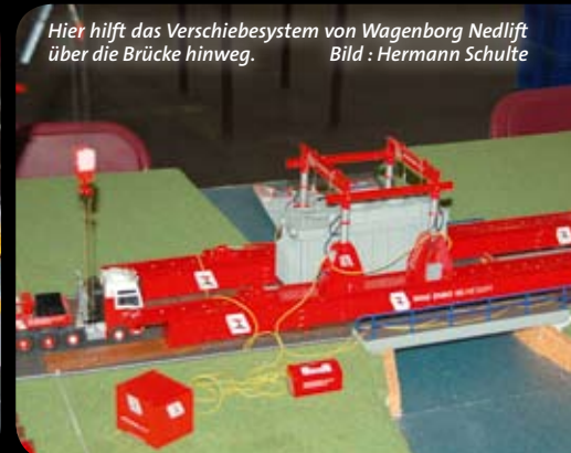
Hier hilft das Verschiebesystem von Wagenborg Nedlift über die Brücke hinweg.