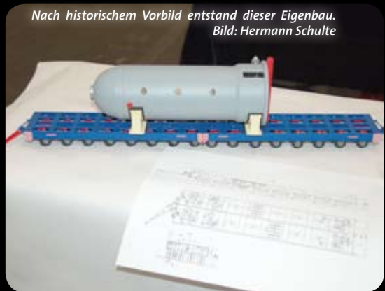
Nach historischem Vorbild entstand dieser Eigenbau.