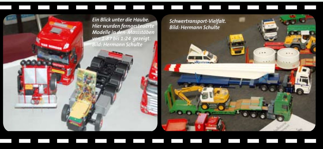
Ein Blick unter die Haube. Hier wurden ferngesteuerte Modelle in den Maßstäben von 1:87 bis 1:24 gezeigt.