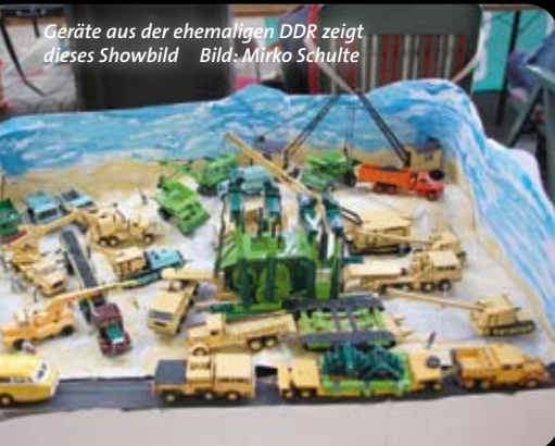
Geräte aus der ehemaligen DDR zeigt dieses Showbild.