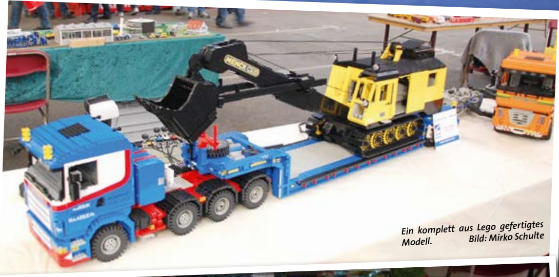
Ein komplett aus Lego gefertigtes Modell.