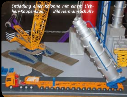
Entladung einer Kolonne mit einem Liebherr-Raupenkran.