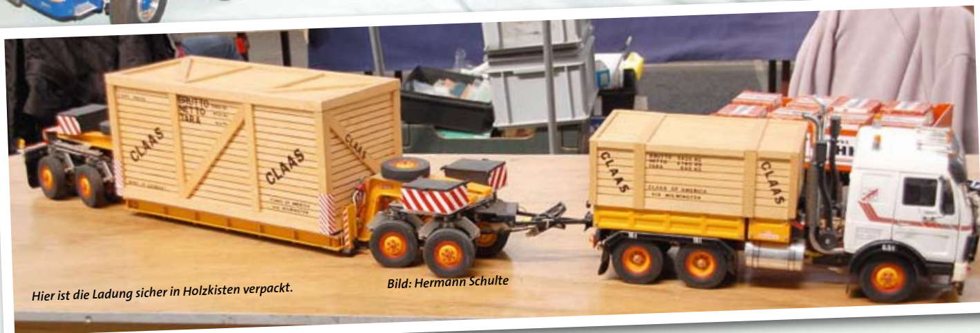
Hier ist die Ladung sicher in Holzkisten verpackt.