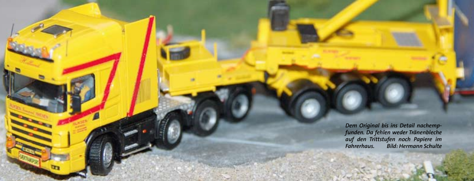
Dem Original bis ins Detail nachempfunden. Da fehlen weder Tränenbleche auf den Trittstufen noch Papiere im Fahrerhaus.

... lockt die Modelshow Europe im April zahlreiche Kran- und Schwertransportfans nach Holland. Dort geben sich Fachleute der Branche genauso ein Stelldichein wie all jene, die einfach nur von Kranen und Schwertransporten begeistert sind.