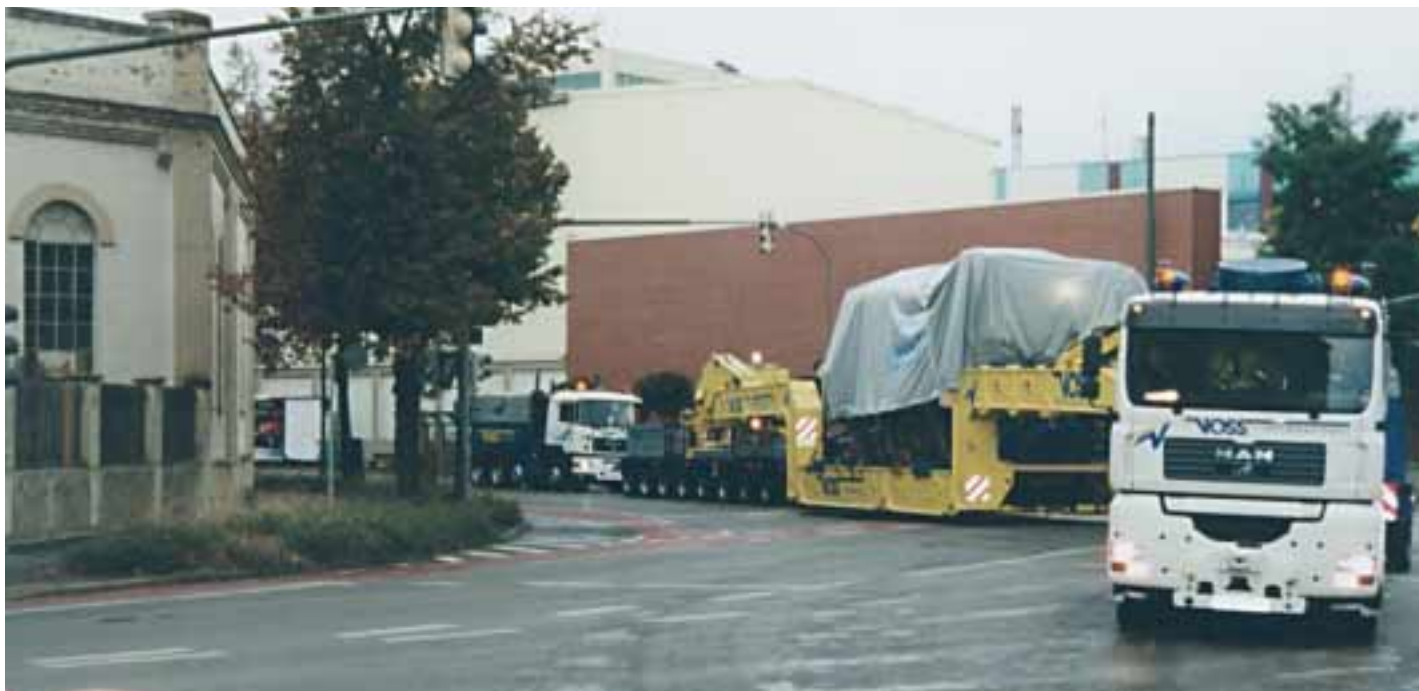
Lässt sich fotografisch nicht darstellen: der Zug fährt rückwärts, um an der nächsten Kreuzung nicht umkuppeln zu müssen.