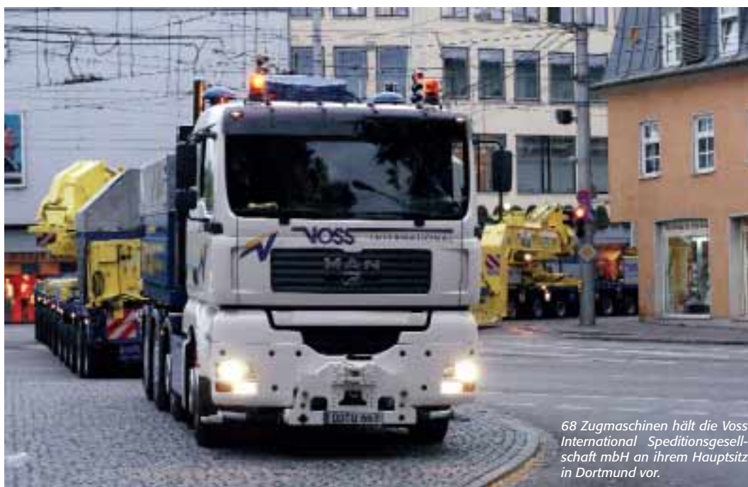
68 Zugmaschinen hält die Voss International Speditionsgesellschaft mbH an ihrem Hauptsitz in Dortmund vor.

Der Fahrer muss nicht mehr Schalten, kann es aber, wobei ihm aber die Kuppelvorgänge abgenommen werden. Er muss nur Gaspedal und Bremse betätigen, das Kupplungspedal ist bei dieser Getriebeeinheit ersatzlos entfallen. Die Konfiguration erlaubt ruckfreies Anfahren und zentimetergenaues Rangieren auch unter schwierigen Bedingungen. Zudem ist während der Fahrt das Umschalten zwischen Automatikbetrieb und manueller Gangwahl jederzeit möglich. Die Charakteristik des 12-Gang Getriebes wurde den Anforderungen des Schwertransportes angepasst.