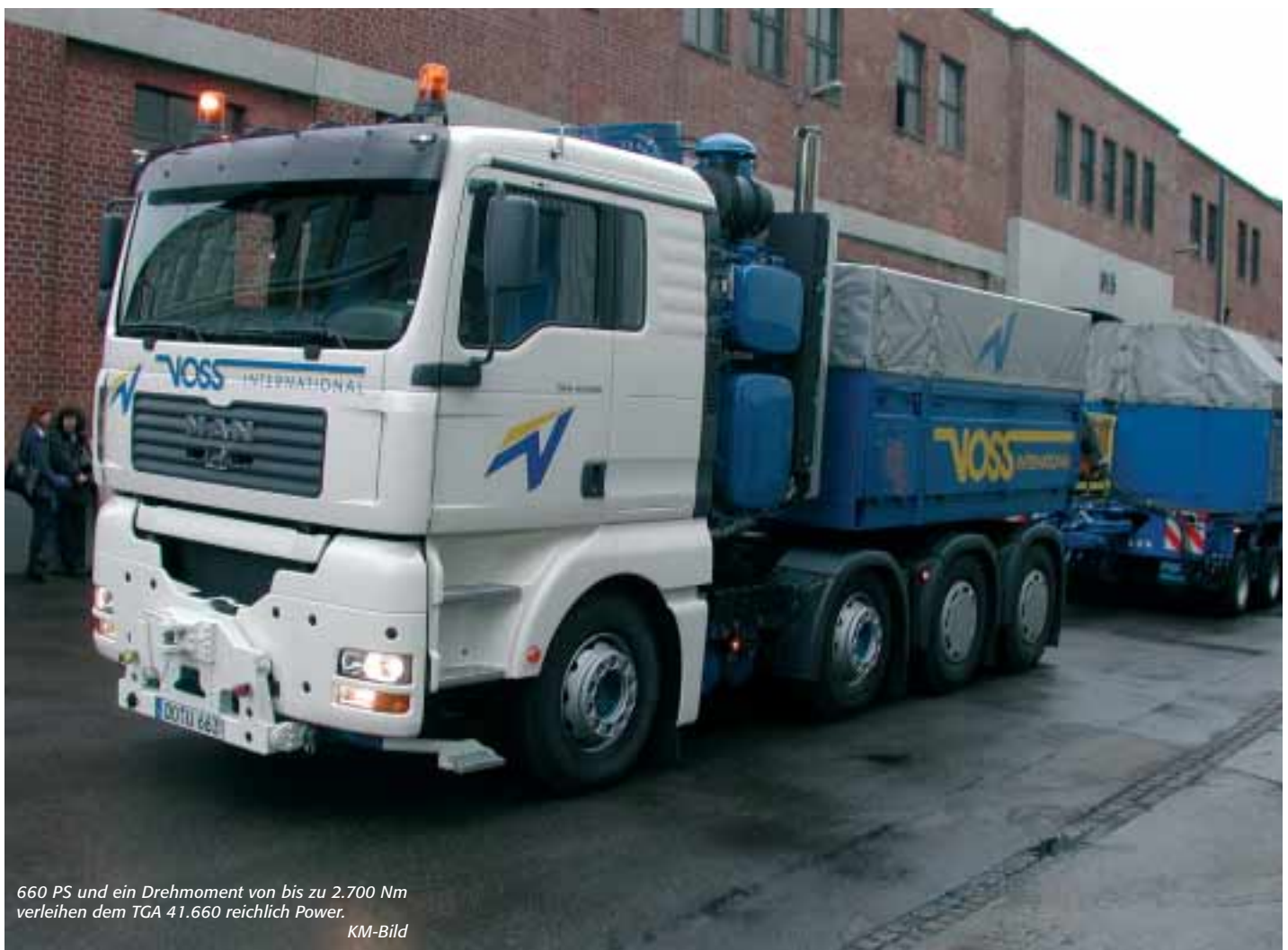
660 PS und ein Drehmoment von bis zu 2.700 Nm verleihen dem TGA 41.660 reichlich Power.

Der 18,27 l V10-Motor mit Common Rail-Einspritzung ist der stärkste MAN-