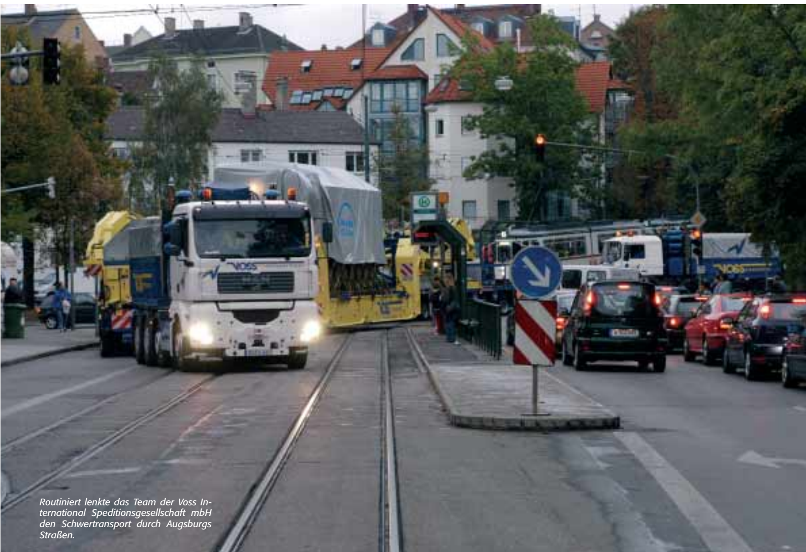
Routiniert lenkte das Team der Voss International Speditionsgesellschaft mbH den Schwertransport durch Augsburgs Straßen.

Motor, der in Lkw eingebaut wird. Wesentliche technische Merkmale sind die extern gekühlte Abgasrückführung und für jede Zylinderbank je eine eigene Common Rail-Einspritzung sowie ein eigener Turbolader. Mit 485 kW (660 PS) Nennleistung und einem Drehmo-