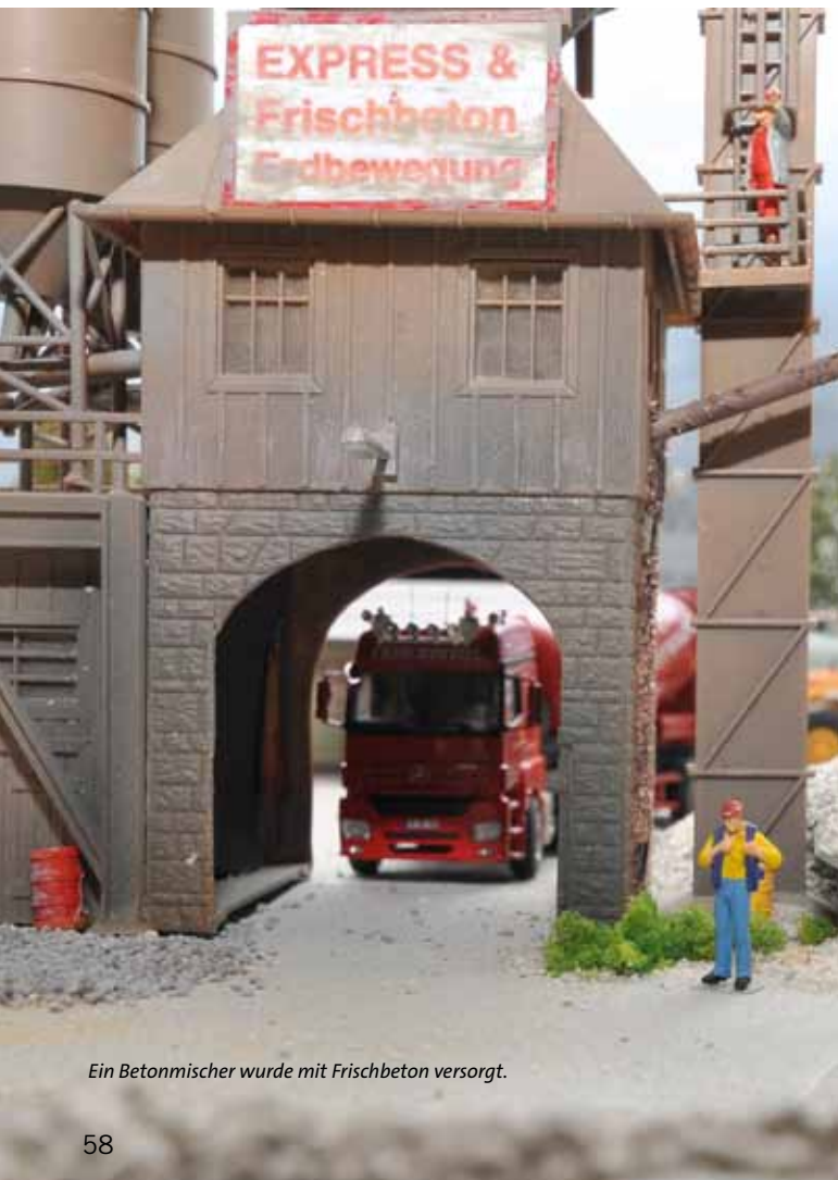
Ein Betonmischer wurde mit Frischbeton versorgt.