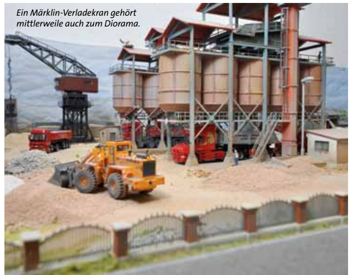
Ein Märklin-Verladekran gehört mittlerweile auch zum Diorama.

Auch die passende Geschichte rund um das Diorama, das übrigens komplett beleuchtet ist, hat