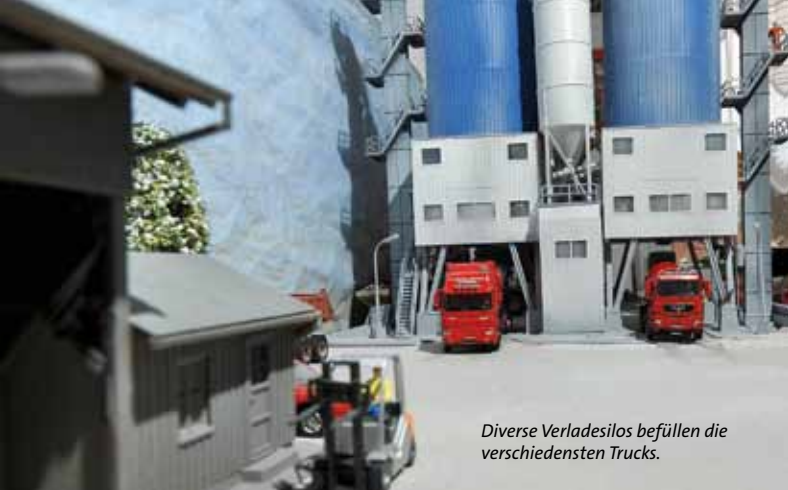
Diverse Verladesilos befüllen die verschiedensten Trucks.