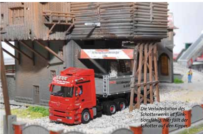
Die Verladestation des Schotterwerks ist funktionsfähig: hier fällt der Schotter auf den Kipper.

drei Beton-Mischanlagen zur Verfügung. Im Einsatz sind circa 80 Kipper, zehn Mischer und fünf Asphaltkocher.