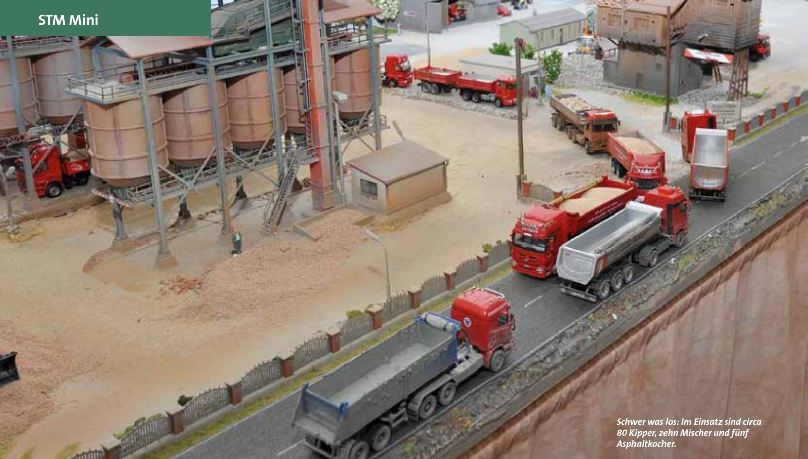
Schwer was los: Im Einsatz sind circa 80 Kipper, zehn Mischer und fünf Asphaltkocher.