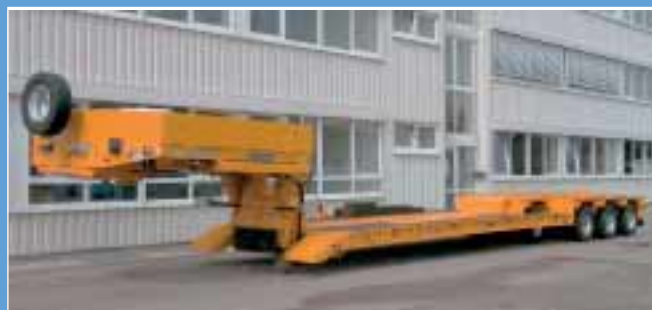
5. Goldhofer: Freigelände, Stand N820/1