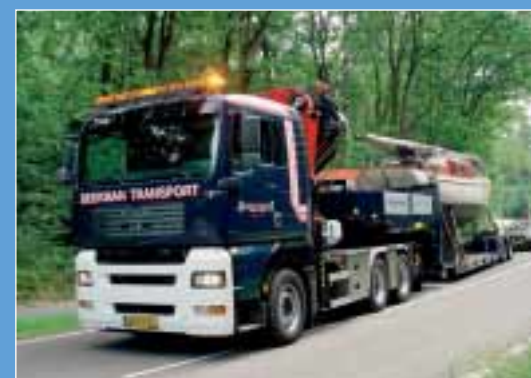
6. MAN Nutzfahrzeuge: Halle B4, Stand 209