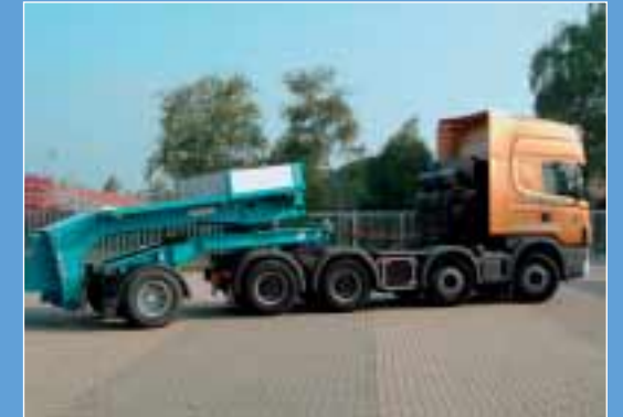
8. Scania: Halle B4, Stand 116