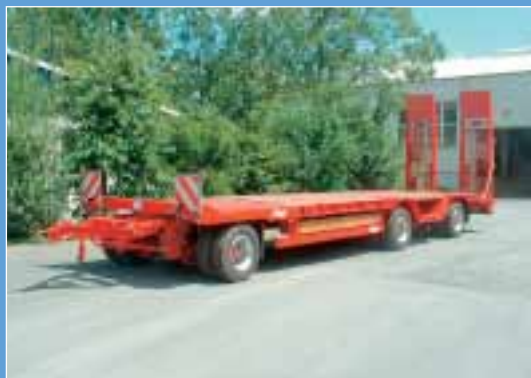
4. Fliegl: Freigelände, Stand N1018/7