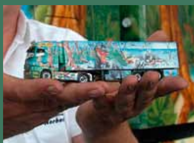
Herpa Truck Show Modellbau Friedrichshafen 2009

Rund 350 namhafte Aussteller, Hersteller und Kleinserienanbieter verwandeln mit ihrem hochwertigen Angebot aus allen Modellbausparten die Messehallen in Friedrichshafen wieder in eine faszinierende Modellbauwelt. Im neunten Jahr der Faszination Modellbau Friedrichshafen bietet der Veranstalter eine neue und optimierte Hallenaufteilung, die einzelne Themenbereiche besser miteinander verbinden und dadurch kürzere Wege ermöglichen soll. Freunde des Truckmodellbaus werden in Halle 5 fündig. Hier gibt es zudem auch den TruckModell-Festival Parcours im Maßstab 1 : 8 und 1 : 16.